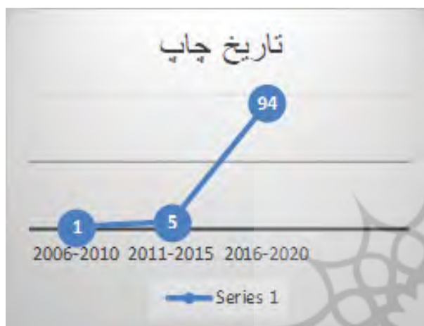
شکل ۱- تاریخ چاپ کتب