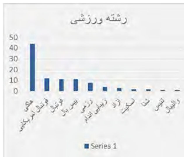
شکل ۴- رشته ورزشی پرداخته شده در کتاب