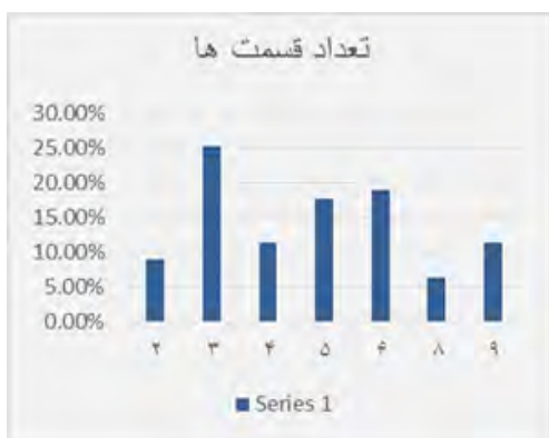
شکل ۹- تعداد قسمت‌های سریال