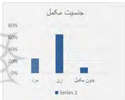
شکل ۷- جنسیت مکمل داستان

شکل ۱۰ نشان می‌دهد ۲۹/۱۰ درصد از کتاب‌های سریالی که در جمع ۱۰۰ کتاب برتر حضور دارند، قسمت اول سریال هستند. ۲۲/۸۸ درصد از کتاب‌های سریالی که در جمع ۱۰۰ کتاب برتر حضور دارند، قسمت دوم و ۱۹ درصد از کتاب‌ها قسمت سوم سریال خود هستند.