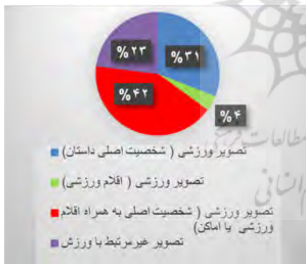
شکل ۵- تصویر روی جلد کتب

شکل ۲ نشان می‌دهد ۱۸ درصد از فصول با شماره‌های عددی، ۲۶ درصد از فصول با نامی مجزا برای هر فصل و ۵۶ درصد از فصول با نام شخصیتی از داستان نام گذاری شدند.