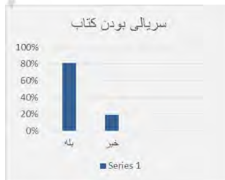
شکل ۸- سریالی بودن کتب

کتاب به‌عنوان رسانه‌ای سنتی، در مقابل سایر رسانه‌ها به‌خصوص رسانه‌های نوین در کشور ما مخاطبان کمتری دارد، اما در طی سالیان همچنان ارزش و اعتبار خود را حفظ کرده است و از عناصر مهم زندگی بشر است. همچنین ابزاری است که می‌تواند در جهت‌دهی به‌سوی هدفی دلخواه کمک شایان توجه کند. برخلاف کشورهای جهان سوم، در کشورهای توسعه‌یافته نویسندگی و انتشار کتاب فعالیت پویا و بسیار مهمی تلقی می‌شود و کشورها از آن در جهت رسیدن به اهداف خود استفاده می‌کنند. کتاب‌های با ژانر ورزشی در بسیاری از کشورها فراوان دیده می‌شود.