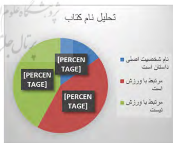
شکل ۳- تحلیل نام کتب

شکل ۵ نشان می‌دهد ۴ درصد از کتاب‌ها تصویری ورزشی (اقلام ورزشی) دارند، ۲۳ درصد از کتاب‌ها تصویری نامرتبط با ورزش دارند، ۳۱ درصد از کتاب‌ها دارای تصویر ورزشی (شخصیت اصلی داستان) هستند و طرح جلد ۴۲ درصد از کتاب‌ها دارای تصویر ورزشی (شخصیت اصلی داستان به همراه اقلام ورزشی یا امکان ورزشی) است.