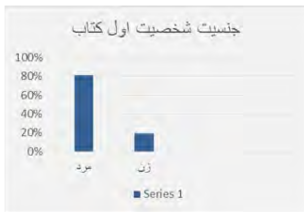
شکل ۶- جنسیت شخصیت اول داستان

شکل ۹ نشان می‌دهد ۲۵/۳۰ درصد از کتاب‌ها جزئی از یک سریال سه‌قسمتی، ۱۹ درصد از کتاب‌ها جزئی از یک سریال شش‌قسمتی و ۱۷/۷۰ درصد از کتاب‌ها جزئی از یک سریال پنج‌قسمتی هستند.