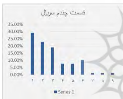
شکل ۱۰- چندمین قسمت از یک سریال

شکل ۶ نشان می‌دهد ۸۱ درصد از شخصیت‌های اول کتاب‌ها مرد و ۱۹ درصد زن هستند.