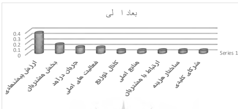
شکل ۳- رتبه‌بندی ابعاد اصلی مدل کسب‌وکار بر اساس فرایند تحلیل سلسله مراتبی (AHP)