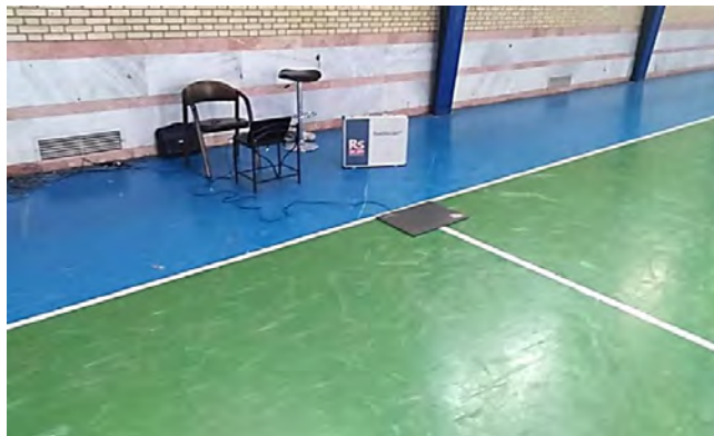
شکل ۱- مسیر حرکت شرکت‌کننده‌ها

داده‌های حاصل از دستگاه فوت اسکن توسط نرم‌افزار نسل دوم فوت اسکن ۱۷ تجزیه و تحلیل شد. این نرم‌افزار به صورت خودکار پا را به ده نقطه آناتومیکی تقسیم می‌کند: (۱) انگشت شست؛ (۲) انگشتان کوچک؛ (۳) متاتارسال اول؛ (۴) متاتارسال دوم؛ (۵) متاتارسال سوم؛ (۶) متاتارسال چهارم؛ (۷) متاتارسال پنجم؛ (۸) وسط پا؛ (۹) بخش داخلی پاشنه و (۱۰) بخش خارجی پاشنه. برای هر یک از این نواحی، حداکثر فشار کف پایی در هر کوشش به دست آمد و میانگین آن برای تحلیل‌های آماری در نظر گرفته شد. علاوه بر این، این نرم‌افزار به صورت خودکار پنج لحظه خاص را مشخص می‌کند: زیرفازهای استانس؛ (۱) اولین تماس پا (لحظه‌ای که پا اولین تماس خود را با صفحه فشار برقرار می‌کند)؛ (۲) تماس اولین متاتارسال (لحظه‌ای که یکی از متاتارسال‌ها با صفحه فشار تماس پیدا می‌کند)؛ (۳) صاف شدن جلوی پا (اولین لحظه‌ای که تمام متاتارسال‌ها با صفحه فشار تماس پیدا می‌کنند)؛ (۴) جدا شدن پاشنه (لحظه‌ای که تماس پاشنه با صفحه فشار تمام می‌شود) و (۵) آخرین تماس پا با دستگاه (آخرین تماس پا با صفحه). بین این پنج نقطه، چهار فاز کلیدی مشخص می‌شود: (۱) فاز تماس اولیه (بین تماس اولیه پا و تماس اولین متاتارسال)؛ (۲) فاز تماس جلوی پا (بین تماس اولین متاتارسال تا صاف شدن جلوی پا)؛ (۳) فاز صاف شدن پا (بین صاف شدن جلوی پا تا جدا شدن پاشنه) و (۴) فاز پوش آف جلوی پا (بین صاف شدن جلوی پا تا تماس انتهایی پا). برای هر کدام از این فازها، مدت زمان نسبی استانس بر حسب درصد محاسبه شد (شکل شماره ۲).