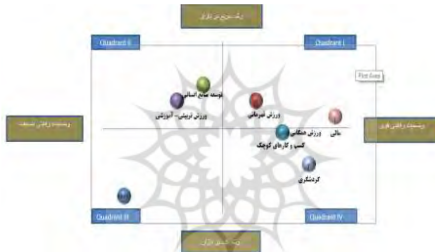
شکل ۲. وضعیت ابعاد صنعت ورزش کشور در پسا کرونا برحسب ماتریس استراتژی اصلی

شکل ۲ نتایج حاصل از نرم‌افزار CHECKMATE به منظور ترسیم استراتژی اصلی را نشان می‌دهد. جایگاه هریک از موارد نشان می‌دهد که به چه نوع استراتژی‌هایی برحسب شدت رشد گزاره‌ها و وضعیت رقابتی آنها نیاز داریم. برای توسعه منابع انسانی، به ورزش تربیتی-آموزشی و توسعه بازار، یکپارچگی‌های افقی و توسعه تنوع محصولات ورزشی برای منابع انسانی و ورزش تربیتی-آموزشی نیاز داریم. برای حصول موفقیت در ورزش قهرمانی و منابع مالی به استراتژی‌های تنوع‌سازی، رسوخ و یکپارچگی بخش‌ها نیازمندیم. برای ورزش همگانی، کسب و کارهای کوچک و گردشگری ورزشی به استراتژی‌های تنوع‌سازی و مشارکت نیازمندیم.