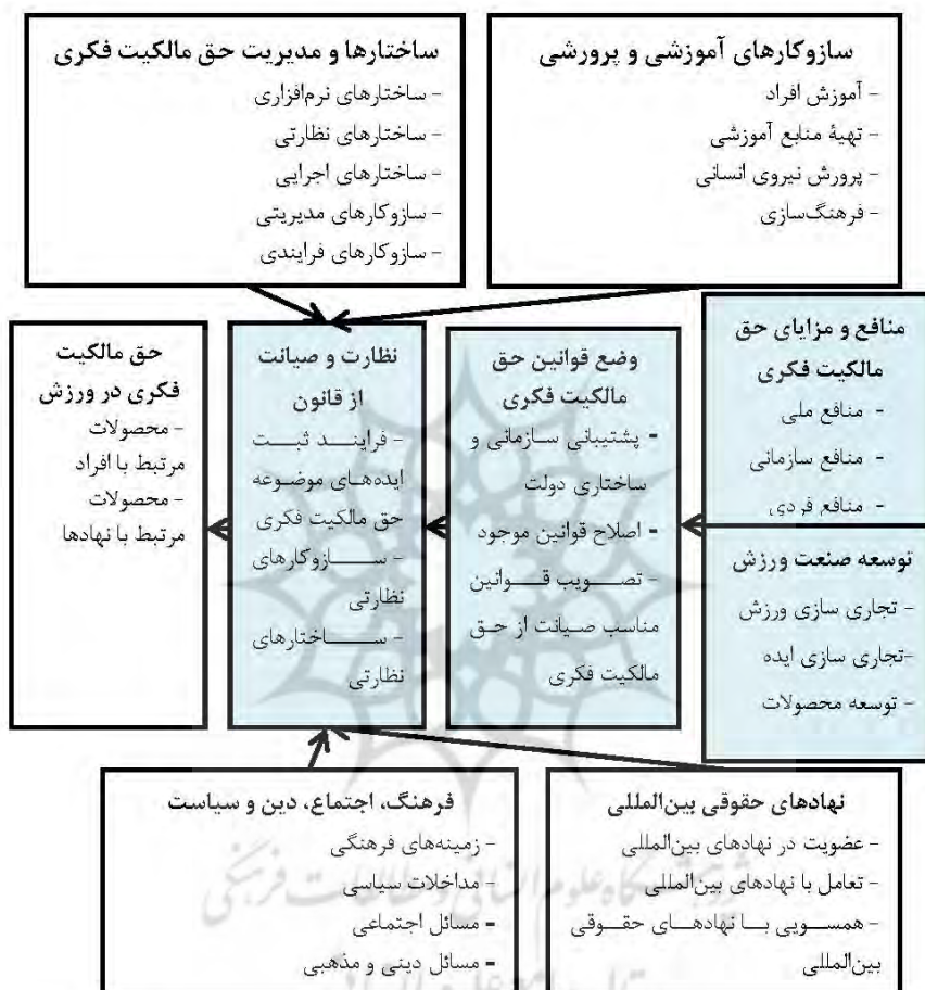
شکل ۲. الگوی پارادایمی حق مالکیت فکری در ورزش

به‌دست آمده، همراه با جزئیات هر بخش در شکل ۲ نشان داده شده است. این الگو نظریه‌ای است که در جریان نوشتن روایت توصیفی و تحلیلی خود و برای گزارش نتایج تحلیل‌های پژوهش در قالب نمودار یکپارچه‌ساز به آن رسیدیم. در بخش بحث و نتیجه‌گیری مدل تدوین‌شده مورد بحث قرار گرفته است.