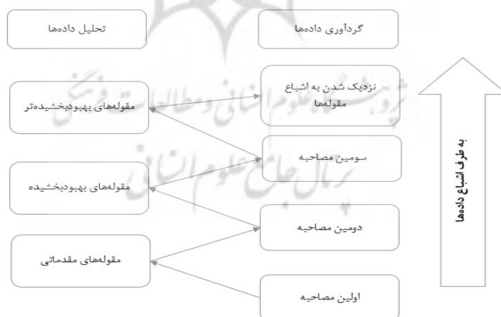
شکل ۱. گردآوری و تحلیل داده‌ها به صورت زیگزاگ

از آنجا که هدف این پژوهش طراحی الگوی جانشین‌پروری منابع انسانی در سازمان‌های ورزشی است، از روش کیفی استفاده شد. بدین منظور با اجرای مصاحبه و طرح پرسش‌های نیمه‌ساختاریافته در خصوص جانشین‌پروری منابع انسانی در سازمان‌های ورزشی به جمع‌آوری داده‌ها اقدام شد و به کمک روش تحلیل تماتیک دسته‌بندی و الگوی جانشین‌پروری منابع انسانی در سازمان‌های ورزشی طراحی شد. در این پژوهش با استفاده از روش نمونه‌گیری هدفمند، در مجموع با یازده نفر از استادان و خبرگان (دارای سابقه مدیریتی و شغلی در سازمان‌های مختلف ورزشی) که اطلاعات مناسب در این خصوص داشتند و بر موضوع مسلط بودند، مصاحبه شد. این تعداد نمونه شامل استادان مدیریت ورزشی است. سؤالات مربوط به بخش مصاحبه شامل دو سؤال کلی به این شرح بود: به نظر شما عوامل مؤثر بر جانشین‌پروری در سازمان‌های ورزشی چیست؟ از دیدگاه شما چه عواملی به‌صورت زمینه‌ای بر جانشین‌پروری در سازمان‌های ورزشی مؤثر است؟ در این پژوهش، از مصاحبه نهم به بعد تکرار مشاهده شد، اما به دلیل اطمینان از داده‌های دریافتی و رسیدن به اشباع نظری تا مصاحبه یازدهم ادامه یافت. نحوه رسیدن به اشباع نظری در شکل ۱ نمایش داده شده است.