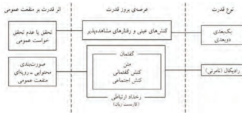
شکل ۲. چارچوب مفهومی پژوهش