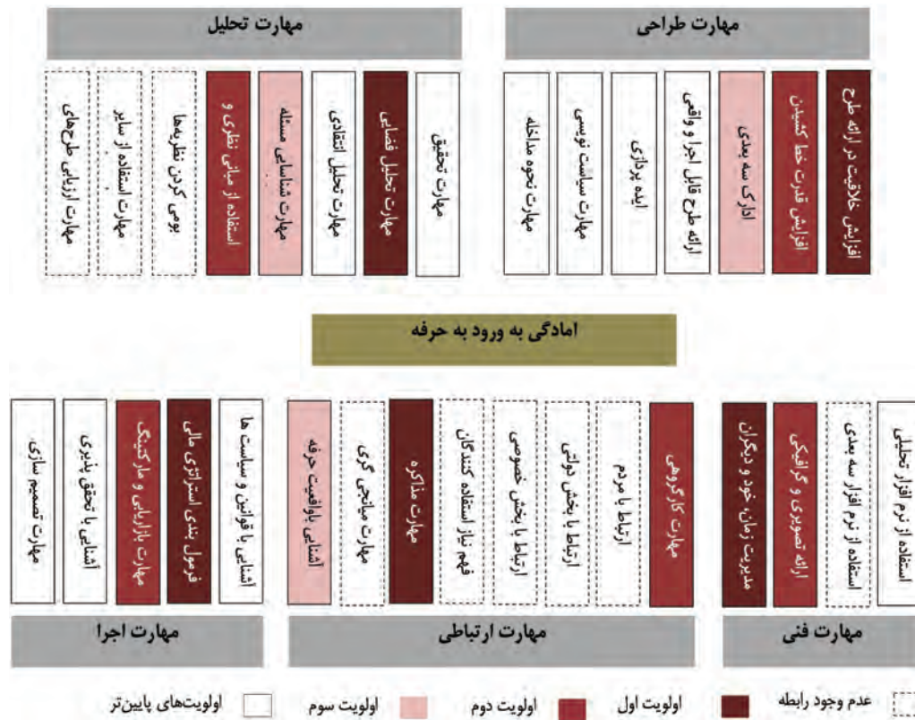
شکل ۲. بررسی تأثیر زیرمهارت‌ها بر آمادگی ورود به حرفه