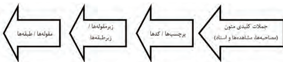
شکل ۰۱. مراحل کدگذاری در تحلیل محتوای کیفی با رویکرد استقرایی (Glaser & Strauss, 1990)

در تحلیل محتوای استقرایی نیز پژوهشگر از به‌کارگیری طبقات از قبل تعیین شده اجتناب می‌ورزد و در عوض اجازه می‌دهد که طبقات و نام آنها از درون داده‌ها بیرون آیند. در این روش، به جای اینکه شروع گردآوری داده‌ها با اتکا به فرضیاتی باشد که از دل یک نظریه بیرون آمده است، نقطه شروع آن بر اساس سؤال و هدف پژوهش است. بنابراین پژوهشگر در داده‌ها کاملاً غرق شده تا به یک درک یا بصیرت جدیدی دست پیدا کند. ابتدا تحلیل داده‌ها با خواندن مکرر متن برای غوطه‌ور شدن در آنها و یافتن یک درک کلی آغاز می‌شود. سپس متون کلمه به کلمه خوانده می‌شود تا کدها استخراج شوند. این فرآیند به‌طور پیوسته از استخراج کدها تا نام‌گذاری آنها تداوم می‌یابد. پس از آن کدها بر اساس تفاوت‌ها یا شباهت‌هایشان به داخل طبقات دسته‌بندی می‌شوند و در پایان به ازای هر مفهوم، شواهدی از متن نقل قول می‌شود (Shan-non, 2005). بعد از اتمام کدگذاری داده‌ها، بر اساس اشتراکاتی که با یکدیگر دارند، تحت یک مقوله (یا طبقه) واحد درآورده می‌شوند. به این علت در نمودار از زیر مقوله‌ها یا زیر طبقه‌ها نام برده شده است که گاهی یک مقوله خود می‌تواند چندین زیر مقوله داشته باشد (مومنی‌راد و دیگران، ۱۳۹۲، ۲۰۸).