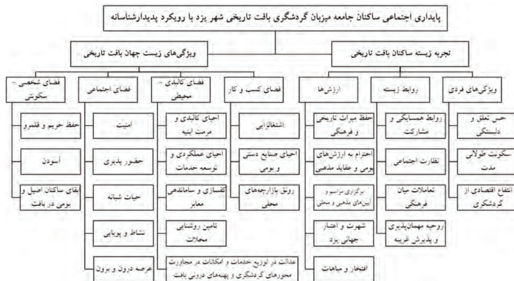
شکل ۹. مدل مفهومی روایت پدیدارشناسانه ساکنان بافت تاریخی شهر یزد در مواجهه با پدیده گردشگری

بدین ترتیب نتایج حاصل از پدیدارشناسی بررسی‌های عمیق اسنادی، مشاهدات میدانی نیمه‌ساختاریافته محقق و مصاحبه‌های ژرف‌کاوانه نیمه‌ساختاریافته با ساکنان بافت تاریخی شهر یزد، به‌منظور کشف معنای واقعی پدیده گردشگری و ادراک تجربه زیسته ساکنان، با استفاده از تکنیک کدگذاری، مقوله‌بندی و استخراج شد. با جمع‌بندی این موارد چارچوب مفهومی پدیدارشناسانه ساکنان بافت تاریخی شهر یزد در مواجهه با گردشگری و مؤلفه‌های اصلی و فرعی آن ارائه شده است.