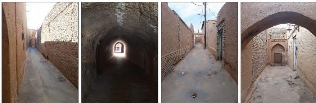
شکل ۸. شرایط نامناسب کالبدی و محیطی در محدوده‌های خارج از مسیر گردشگری بافت (زمستان ۱۳۹۷)

با فاصله گرفتن از مسیرهای گردشگری و ورود به درون بافت و محلات مسکونی، چهره معابر و ساختمان‌ها تفاوت چشمگیری می‌کند. دیگر از کفپوش‌های سنگفرش شده، دیوارهایی با خشت‌مال نو و با کیفیت، روشنایی‌های سالم و کافی، پاکیزگی و نبود زباله در معابر اثری نیست. چهره نیازمند توجه و اصلاح بافت تاریخی را باید در کوچه پس‌کوچه‌های به دور از محورهای گردشگری جست. آنچه که گردشگری از مرمت و امکانات برای ساکنان بافت تاریخی شهر یزد به ارمغان آورده است تنها در مسیرهای تعیین شده و نزدیک به مراکز جاذب گردشگر، نمود یافته است و قامت بافت در نقاط دور از این مراکز همچنان نحیف و نیازمند رسیدگی است به گونه‌ای که تعداد قابل توجهی از منازل موجود در این بخش‌ها همچنان در روند متروکه شدن و یا واگذاری به اتباع افغان و عرب هستند.