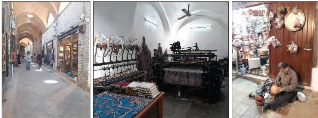
شکل ۵. رونق کسب‌وکارها، کارگاه‌ها و صنایع دستی در محلات بافت تاریخی (زمستان ۱۳۹۷)

امیرچخماق و خیابان قیام (بازار خان، زرگرها، مسگرها، سراج‌ها) به شکل کلان‌تر دیده می‌شود. به گونه‌ای که ارزش اقتصادی واحدهای تجاری موجود در این محدوده‌ها نسبت به چند سال گذشته و قبل از ثبت جهانی یزد چندین برابر شده و مغازه‌هایی که در ایام نه چندان دور متروکه و تعطیل شده بودند مجدداً فعالیت خود را از سر گرفته‌اند.