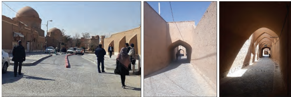
شکل ۳. مرمت کالبدی (بدنه و کف) محورهای گردشگری بافت تاریخی شهر یزد در سال‌های اخیر (زمستان ۱۳۹۷)

حسی مبهم برای مکاشفه، انسان را جذب گشت‌وگذار در کوچه پس‌کوچه‌های بافت تاریخی می‌کند؛ گذرهای پریپیچ‌وخم، دیوارهای خشتی و بدون روزن به درون، سایه روشن پایاب قنات‌ها، کوچه‌های سرپوشیده و ساباط‌ها، همگی انسان را به تخیل درباره آنچه دیده نمی‌شود وامی‌دارند. بافت تاریخی یزد، سکونتگاهی است که برهم‌کنشی بین آشکار و پنهان و ارتباط زمین و آسمان را به خوبی می‌شناسد و آن را حفظ می‌کند و کشف و تخیل انسان را برمی‌انگیزد و از این رو همیشه زنده و جذاب باقی می‌ماند. از خیابان فهادان، می‌توان قدم در کوچه بقعه دوازده امام گذاشته و وارد بافت (ورودی شمالی) شد. این کوچه به مجموعه‌ای از پربازدیدترین جاذبه‌های گردشگری شهر یزد می‌انجامد. با ورود به کوچه، سنگ‌فرش خیابان، دیوارهایی که کاهگل آنها مرمت و نو شده‌اند و نماهایی که به سبک قدیم اما با رنگ و لعاب جدید، نوسازی شده‌اند، همه نشان از تغییرات کالبدی گسترده‌ای در گذرهای اصلی گردشگری بافت در سال‌های اخیر دارند.