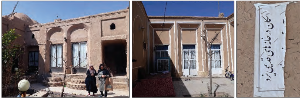
شکل ۷. آماده‌سازی خانه جهت اسکان گردشگران توسط ساکنان بافت تاریخی یزد و دعوت از مسافران به‌منظور بازدید (زمستان ۱۳۹۷)

بسیاری روبرو شده است. پذیرش غریبه‌هایی از سراسر ایران و جهان به عرصه درونی و به محرم‌ترین فضای خانواده یعنی خانه، با توجه به سابقه فرهنگ مذهبی و سنتی مردم یزد و اهمیت موضوع محرمیت، به‌منظور کسب منفعت اقتصادی از طریق تنها داشته ارزشمند قابل عرضه ساکنان به گردشگران که اکنون به‌عنوان منبع درآمد برای ساکنان بافت تاریخی محسوب می‌شود، نشان از تغییر تدریجی فرهنگ و سنت و عادات یزدی‌ها به واسطه تنگناهای معیشتی و وجود فرصتی اقتصادی به نام گردشگری در بافت تاریخی شهر یزد می‌باشد.