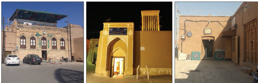
شکل ۶. تبدیل خانه‌های قدیمی بافت تاریخی به خدمات ویژه گردشگری (زمستان ۱۳۹۷)

پدیده‌ای که در مسیرهای گردشگری بافت بسیار چشمگیر است، تعداد زیاد هتل‌ها و اقامتگاه‌های بوم‌گردی، کافه‌ها و رستوران‌ها و همچنین کارگاه‌ها و مغازه‌های فروش صنایع دستی یزد است که با مرمت خانه‌های تاریخی به خدمات گردشگری اختصاص یافته و روند تبدیل خانه‌های قدیمی به اقامتگاه بوم‌گردی در بافت همچنان ادامه دارد. صاحبان خانه‌های تاریخی که در چند سال اخیر به علت فرسودگی شدید کالبدی، ضعف در خدمات و امکانات محلی و افول ارزش اقتصادی و اجتماعی، خانه‌های خود را ترک و به بافت‌های پیرامونی نقل مکان کرده و یا به مهاجران افغان و عرب اجاره داده‌اند، پس از ثبت بافت تاریخی شهر یزد در میراث جهانی یونسکو و چندین برابر شدن ارزش اقتصادی ابنیه بافت، خانه‌های متروکه و یا اجاره داده شده خود را پس از اخذ مجوز از سازمان میراث فرهنگی یزد، مرمت کرده و به هتل، اقامتگاه بومگردی و سایر خدمات گردشگری تبدیل کرده‌اند.