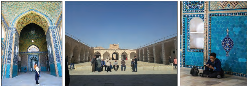
شکل ۴. حضور توأمان گردشگران و ساکنان یزدی در مسجد جامع (زمستان ۱۳۹۷)

در ادامه مسیر و پس از گذر از کوچه‌های آشتی‌کنان، از زیر ساباط‌ها، طاق‌ها و تویزه‌ها و عبور از میان بازارچه‌ها و حسینیه‌های محلات فهادان و شاه‌ابوالقاسم، تجربه رویایی حقیقی و آرامشی خیال‌انگیز در کوچه پس‌کوچه‌های بافت قدیم یزد، معنای بودن در جهان یزدی‌ها بی‌اختیار بر هر گردشگری القا می‌گردد . مسجدجامع کبیر یزد، در مرکز بافت تاریخی، کاملاً خواناست و به واسطه گنبد و گلدسته‌ها، حس جهت‌یابی را تأمین می‌کند. با ورود به محوطه مسجدجامع، مکانی که چهارگانه زمین، آسمان، ایزدان و میرایان در یک مکان گرد هم آورده شده، با ایجاد حس مکان ، خلوتی برای مراقبه و تفکر فراهم است. در کنار راهنمای گردشگری که در حال توضیح شاهکارهای این اثری هنری است، تعدادی از یزدی‌ها نیز ایستاده‌اند و با دقت به توضیحات گوش می‌دهند و گاه از وصف این داشته‌گرانقدر خود حیرت می‌کنند.