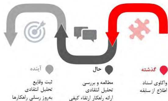
شکل ۱. مسیر پژوهش‌های بنیادی از بازیابی اطلاعات تا ارائه راهکارها

اگر سال‌های آموزش معماری داخلی را به سه بخش گذشته، حال و آینده تقسیم کنیم و وضع حال را حاصل گذشته در نظر بگیریم، آنچه از گذشته در زمان حال وجود دارد همچنان در سایه‌ای از ابهام است. در حقیقت اثرش وجود دارد، اما سندی که بازخوانی و ردیابی را ممکن سازد در دسترس نیست چراکه وقایع در زمان خود ثبت نشده است یا اگر شده باشد از بین رفته و به زمان حال و نسل جدید منتقل نشده است. در چنین شرایطی نخستین گام گردآوری و بازیابی اسناد و اطلاعات خواهد بود. پس از آن است که امکان مطالعه، بررسی و نقد تخصصی فراهم خواهد آمد و در نتیجه آن می‌توان به ارتقای کیفیت آموزش معماری داخلی امید بست. ۲