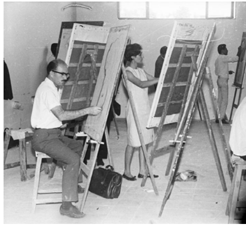
شکل ۵. کارگاه نقاشی در دهه ۵۰