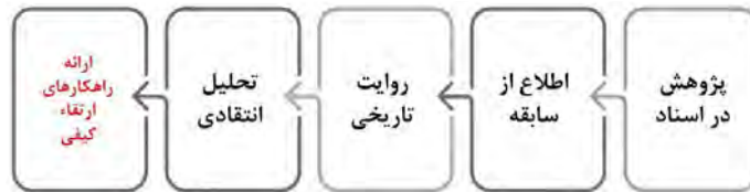
شکل ۲. مراتب پژوهش‌های بنیادی تا رسیدن به راهکارهای ارتقای کیفی

پیداست که ارتقای کیفیت بدون ارزیابی و ارزیابی بدون داشتن اطلاعات کافی ممکن نیست. در مورد آموزش معماری داخلی مشکل جدی پیش روی پژوهش‌های تحلیلی و انتقادی ثبت و ضبط نشدن سابقه است. روشن نیست پیش از این دوران چه اتفاقاتی افتاده، از همین روی شرط اول قدم گردآوری اسناد و آگاهی یافتن از سابقه است.