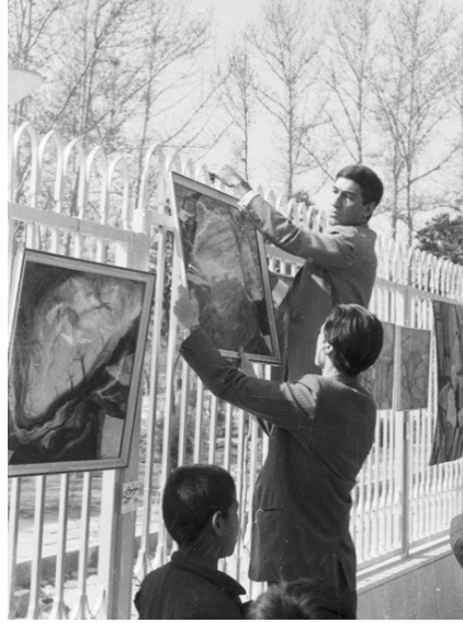
شکل ۸. نمایش عمومی آثار دانشجویان