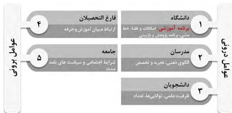
شکل ۴. عوامل درونی و برونی مؤثر بر کیفیت آموزش