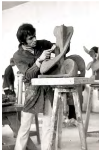
شکل ۶. کارگاه مجسمه‌سازی در دهه ۵۰