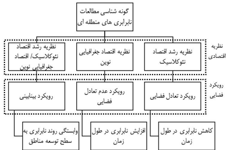
شکل ۳. مدل مفهومی گونه‌شناسی مطالعات نابرابری‌های منطقه‌ای

نابرابری‌های منطقه‌ای در سه دسته جای گرفتند: رویکرد تعادل فضایی که به نظریه رشد اقتصاد نئوکلاسیک رجوع می‌کند؛ رویکرد عدم تعادل فضایی که به نظریه اقتصاد جغرافیایی کروگمن رجوع می‌کند و دسته سوم رویکرد بینابینی که روند افزایشی یا کاهش نابرابری را متأثر از شرایط و سطح توسعه منطقه می‌داند. مدل مفهومی تحقیق حاضر در نمودار زیر منعکس شده است.