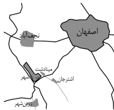
شکل ۱. مکان‌های انتخاب شده به‌عنوان منطقه پیرامونی مکان