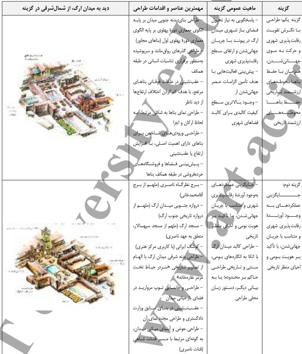
جدول ۲. گزینه‌های طراحی

تاریخی به‌منظور تقلیل پیامدهای منفی جهانی‌شدن پیش‌بینی گردیده‌اند. در طرح ارائه شده، توجه به یادآوری خاطره «سبک تهران» (حبیبی ۱۳۷۵، ۱۳۰-۱۲۸) و نیز اهمیت دوره سلطنت ۵۰ ساله ناصرالدین شاه به عنوان «نقطه عطفی در معماری معاصر» (قبادیان، ۱۳۸۳، ۱۳) مورد توجه ویژه قرار داشته است.