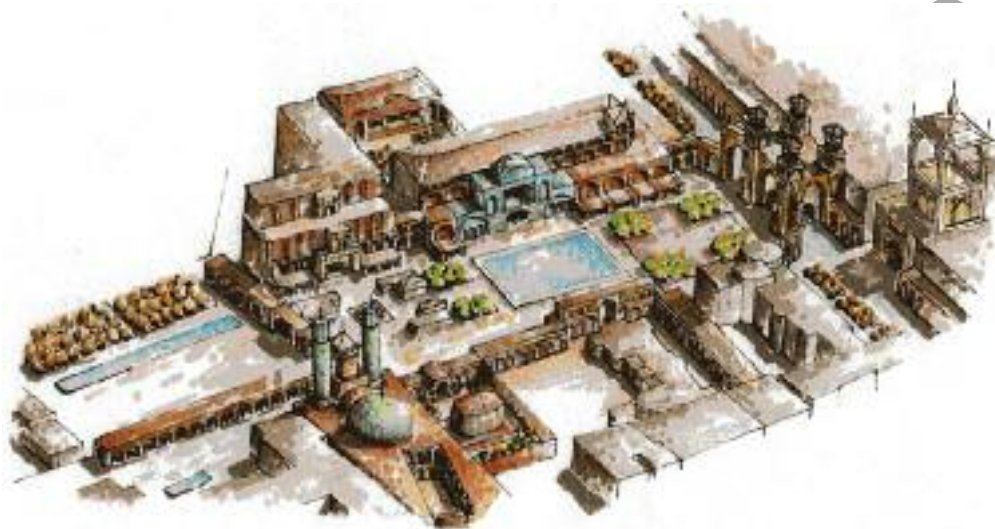
شکل ۴. بیان تصویری سه‌بعدی از میدان ارگ در طرح پیشنهادی

همان‌گونه که گاه اشاره نیز شد، می‌بایست توجه داشت که در نظر گرفتن شرایط تحقق طرح‌ها اهمیتی فراتر از مداخلات کالبدی - فضایی دارند و در حقیقت عمدتاً الزامات و شروط تحقق‌پذیری طرح می‌توانند دستیابی به نتیجه مطلوب را میسر سازند. در مورد طرح حاضر نیز این موضوع اهمیت خاصی دارد، به‌ویژه آنکه، براساس آنچه که پیش‌تر اشاره شد، تهران شهری جهانی محسوب نمی‌شود و به اعتقاد برخی، هنوز حتی جریان جهانی شدن را آغاز هم نکرده است. علاوه بر این، از لحاظ زیرساخت‌ها و مقدمات ضروری برای جهانی شدن شهرها، خلأها و شکاف‌های متعددی نیز در این میان وجود دارند. از همین رو، مهم‌ترین شرایط کلی تحقق‌پذیری هر گونه طراحی و مداخله‌ای از این دست و به بیان دیگر، پذیرش راه‌حل پیشنهادی این مطالعه در زمینه مواجهه فضاهای باز شهری با پدیده جهانی شدن (طراحی با اتکا به دستور زبان محلی، همراه با پیش‌بینی فعالیت‌های ارتقادهنده سطح رقابت‌پذیری شهری)، در مرکز تاریخی تهران، مواردی را در بر می‌گیرد، که از آن جمله‌اند: