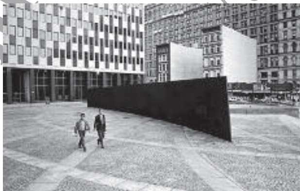
تصویر ۳: Titled Arc قبل از جابجایی، اثر ریچارد سرا، ۱۹۸۱م.، نیویورک

پس از برپایی تعداد زیادی جلسات محاکمه و دادرسی، بالاخره در سال ۱۹۸۹م. با توجه به «سنگینی وزن قانونی خواسته‌های عموم که در اطراف این میدان زندگی یا کار می‌کنند نسبت به خواسته هنرمند» (Kelly, 1996, 15) حکم نهایی دادگاه مبنی بر انتقال این اثر هنری از میدان به محلی دیگر صادر گردید. این واقعه باعث شد ریچارد سرا که آثار زیادی از وی در نقاط مختلف جهان ساخته شده بود از طراحی و ساخت کارهای هنری در عرصه عمومی کنارگیری کند. از آن زمان تا کنون سرنوشت این اثر بیش از هر اثر دیگری در حوزه هنر عمومی اذهان منتقدان و نویسندگان را به خود مشغول کرده و دربارہ آن تعداد زیادی نوشته ارائه گشته است.