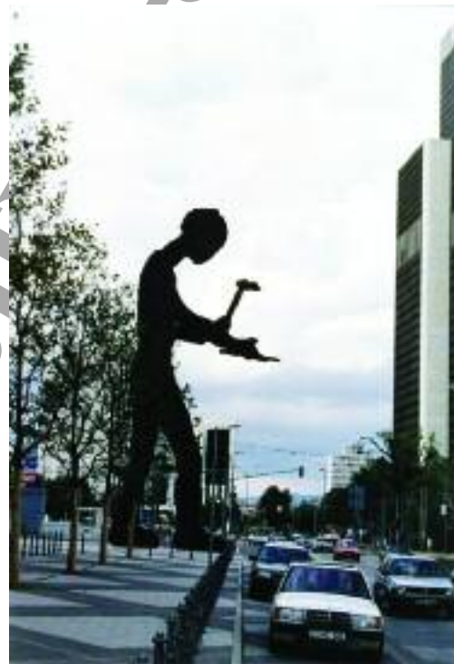
تصویر ۱: Hammering Man ، جاناتان بورفسکی، فرانکفورت

در واقع، در اغلب موارد، هنر نوگرا و زیبایی‌شناسی فرمال آن در این دوره یک «عموم» خالی شده از مفاهیم اجتماعی، اعتقادی و نظام‌های ارزشی را به‌عنوان مخاطب هنر عمومی فرض کرده و آثاری هنرمندمدار، مینیمال و ساخته شده بر اساس مفروضات و ایده‌های شخصی را به نمایش گذاشته، هویت هنر عمومی را که در تعامل با عموم بر مبنای برخی انگاره‌های مشترک به دنبال گشودن زوایای جدیدی است که می‌توان از آن زوایا ساختار اجتماعی هنر را مشاهده کرد، نادیده می‌گیرد (مرادی، ۱۳۸۶، ۸۳). این موضوع تا حدی است که «مکان‌محور بودن» [۲۰] هنر این دوره بیش از آنکه