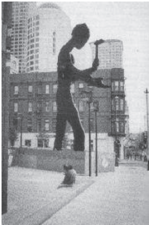
تصویر ۲: Hammering Man ، جاناتان بورفسکی، جلو ورودی موزه هنرهای سیاتل

به‌عنوان مثال، یکی از نمونه‌های بی‌توجهی هنرمندان این دوره به فضای شهری و ابعاد مختلف آن، که تعیین کننده نوع برخورد با عناصر هنر عمومی است، مجسمه Hammering Man اثر جاناتان بورفسکی [۱۹] است که با تغییراتی اندک در اندازه‌اش، در فرانکفورت و سیاتل - که به‌طور حتم دارای زمینه‌های مختلف اجتماعی - مکانی هستند - نصب شده است (تصویر ۱ و ۲).