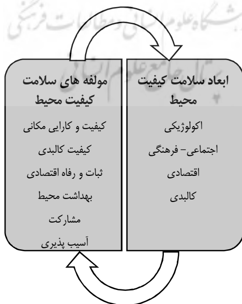
شکل ۳: ابعاد و مؤلفه های مبنای سلامت کیفیت محیطی، منبع یافته های پژوهش، ۱۳۹۶