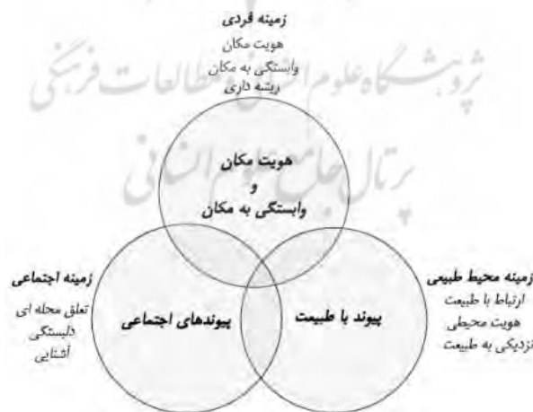
شکل ۱: مدل سه‌قطبی و چهاربعدی تعلق مکانی

مفهوم حس تعلق به مکان: در تحقیقات بسیاری، تعلق مکانی به‌عنوان پیوندهایی که مردم میان خود و مکان‌ها برقرار می‌کنند تعریف شده است (Lewicka, 2008, 211). مکان‌ها و فضاها چیزی بیش از مکانی برای قرارگیری افراد، ساختمان‌ها و ... هستند؛ در واقع، مکان‌ها با تاریخ، خاطرات، هیجانات و معانی آمیخته شده‌اند (William & Vaske, 2003, 838). از دیدگاه پژوهش‌های (وحید و نگینی، ۱۳۹۱؛ Lalli, 1992) تعلق به مکان به‌عنوان یکی از اجزای تشکیل‌دهنده هویت مکان تعریف می‌شود و در مقابل براساس تحقیقاتی چون (Raymond et al., 2010; Kyle et al., 2005)، هویت مکانی نیز می‌تواند یکی از اجزای سازنده تعلق به مکان باشد. بررسی حس تعلق از