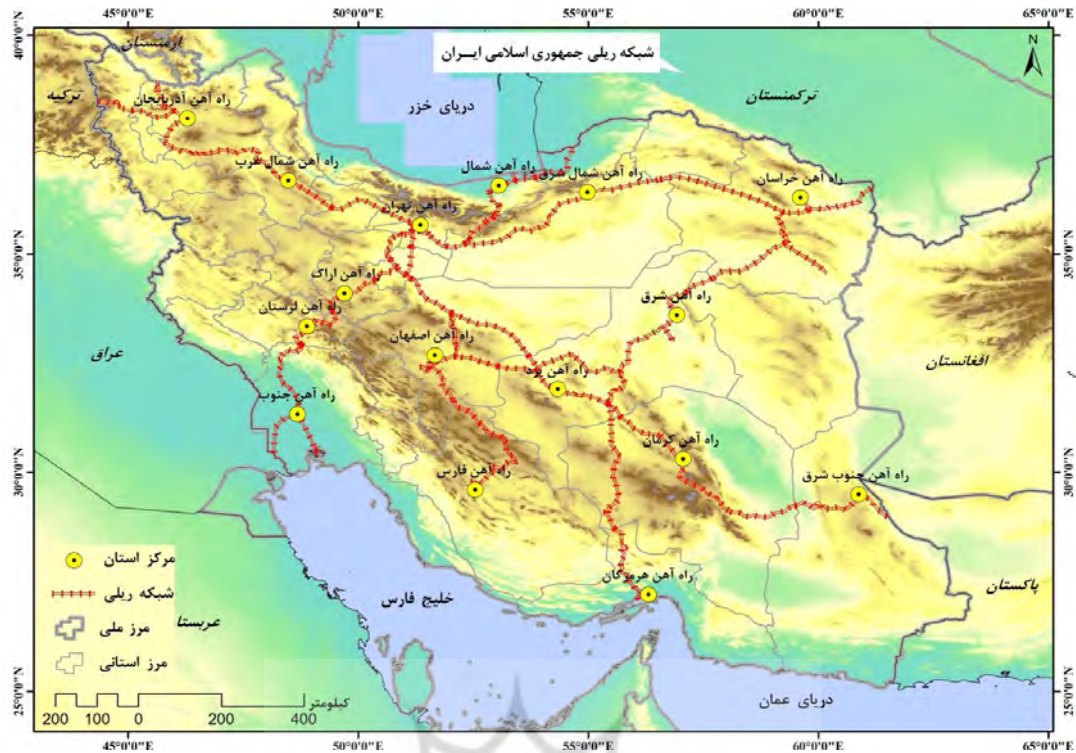
نقشه ۱: شبکه ریلی کشور

شمال - جنوب است، در اهمیت این کریدور باید ذکر شود که این مسیر کوتاه‌ترین مسیر جهت ترانزیت کالاهای کشورهای آسیای میانه که مهم‌ترین بازار ترانزیت ریلی کشور هستند، می‌باشد؛ همچنین استان‌های چهار محال و کهگیلویه نیز فاقد شبکه ریلی هستند، این استان‌ها نیز به عنوان کریدور جنوب به مرکز و شرق به غرب کشور در اتصال به شبکه ریلی قادر به نقش‌آفرینی در توسعه بیشتر کشور خواهند بود؛ همچنین استان‌های غربی کشور (ایلام، کرمانشاه، همدان، و کردستان) با وجود اهمیتی که در کریدور غربی کشور دارند، به شبکه ریلی دسترسی ندارند. در شمال غرب کشور نیز استان اردبیل به عنوان یک استان مرزی و قابلیت دسترسی به دروازه ورودی و خروجی جهت صادرات و واردات، فاقد شبکه ریلی است، ناگفته نماند که علاوه بر توان‌ها و فرصت‌های ذکر شده می‌بایست به توان‌های گردشگری هر یک از استان‌ها نیز توجه خاصی مبذول شود. از آنجا که توسعه متوازن و عدالت سرزمینی از اصول آمایش سرزمین است، وصل مناطق مختلف و به‌ویژه مستعد می‌تواند به توسعه اقتصادی مناطق و کل کشور منجر