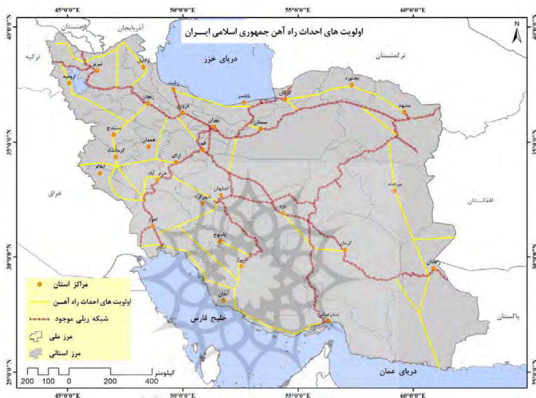
نقشه ۴: اولویت‌های احداث شبکه ریلی

بار مرزی رتبه اول را به خود اختصاص می‌دهد، همچنین در تعداد پرسنل، تناژ بار بارگیری‌شده و تعداد واگن‌های بارگیری‌شده بعد از یزد در جایگاه دوم قرار می‌گیرد. در میزان درآمد بار داخلی و درآمد ترانزیت رتبه سوم را داراست و در جابجایی تناژ بار ناخالص در مقام چهارم قرار دارد. داشتن جایگاه