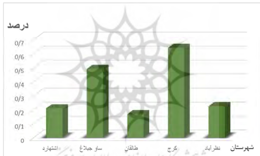
شکل ۲: رتبه‌بندی زیست‌محیطی شهری با تکنیک saw

جدول (۴) رتبه‌بندی شهرستان‌ها را بر اساس نتایج حاصل از مدل ساو نشان می‌دهد.