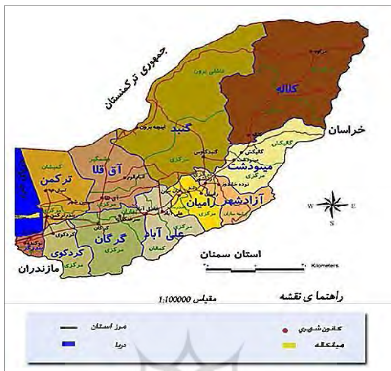
نقشه ۱: موقعیت استان گلستان و تقسیمات سیاسی آن

نقش ملی و فراملی استان به دلیل قرارگیری در مسیر کریدور بین‌المللی شمال - جنوب و نیز تقاطع راه‌های شمالی - جنوبی و شرقی - غربی کشور و همچنین اتصال به شبکه ریلی ملی، وجود صنایع بزرگ و پتانسیل‌های معدنی و صنعتی ویژه، بسیار حساس و تعیین کننده است. سهم درآمدهای گردشگری در استان گلستان علی‌رغم جاذبه‌ها و پتانسیل‌های فراوان گردشگری از جمله دارابودن تنها جزیره ایرانی در دریای خزر و یکصد و بیست کیلومتر نوار ساحلی و بسیاری دیگر از جاذبه‌های ناب گردشگری، به دلیل فقدان زیرساخت‌های لازم، نسبت به کل کشور بسیار پایین است. در جداول یک و دو به صورت اجمالی برخی از شاخص‌های استان گلستان در مقایسه با کشور مشاهده می‌شود.