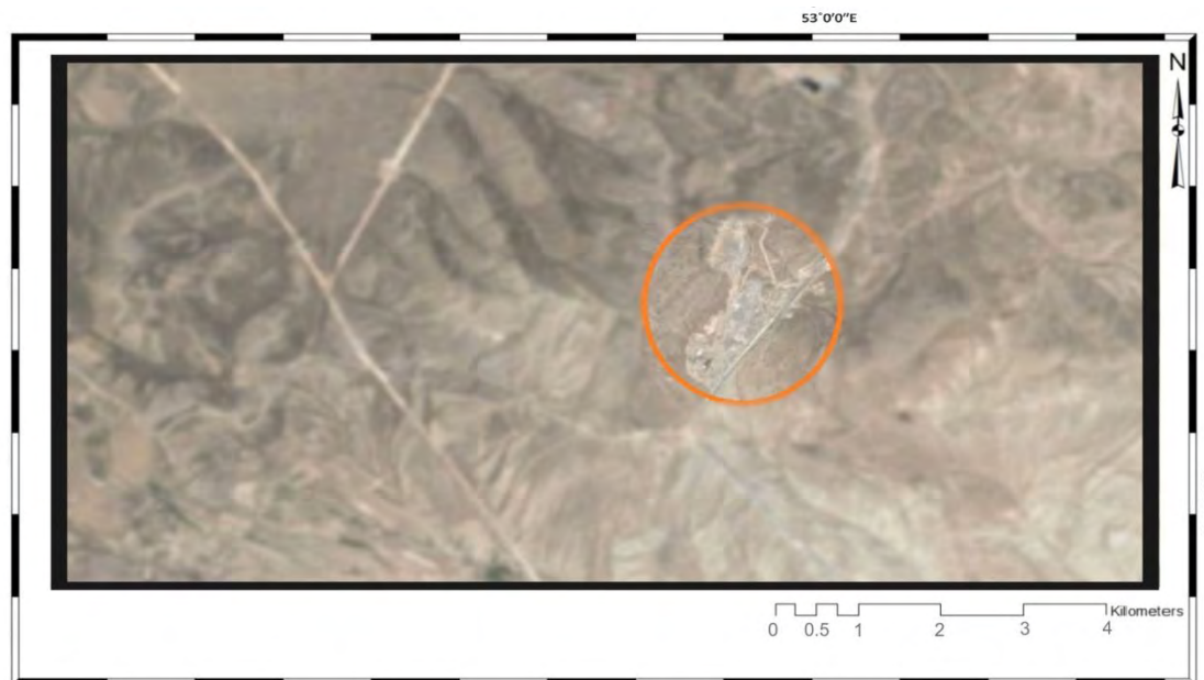
شکل ۲: تصویر ماهواره‌ای از محل فعلی دفن پسماند شهر ساری