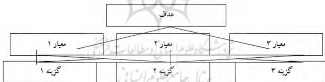
شکل ۳: الگوی ساختار تحلیل سلسله مراتبی

تحلیل سلسله مراتبی: فرآیند تحلیل سلسله مراتبی برای اولین بار توسط توماس ال. ساعتی مطرح شد. این فرآیند مجموعه‌ای از قضاوت‌ها و ارزش‌گذاری‌های شخصی به یک شیوه منطقی است به طوری که می‌توان گفت تکنیک از یک طرف وابسته به تصورات شخصی و تجربه جهت شکل دادن و طرح‌ریزی سلسله مراتبی یک مسئله بوده و از طرفی به منطق، درک و تجربه جهت تصمیم‌گیری و قضاوت نهایی مربوط می‌شود. فرآیند تحلیل سلسله مراتبی یکی از جامع‌ترین سیستم‌های طراحی شده برای تصمیم‌گیری با معیارهای چند گانه است؛ زیرا این تکنیک امکان فرموله کردن مسأله را به صورت سلسله مراتبی فراهم می‌کند و همچنین امکان در نظر گرفتن معیارهای مختلف کمی و کیفی را در مسئله دارد. این فرآیند گزینه‌های مختلف را در تصمیم‌گیری دخالت داده و امکان تحلیل حساسیت روی معیارها و زیر معیارها را دارد، علاوه بر این بر مبنای مقایسه زوجی