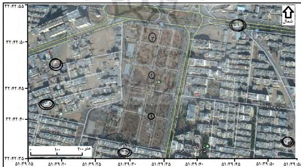
شکل ۲: پایگاه‌های سنجش پارامترهای وضع هوا در درون بوستان گل محمدی و خیابان‌های پیرامون آن

در شش روز تابستانی در سال‌های ۱۳۹۳ و ۱۳۹۴، پایگاه‌هایی به منظور اندازه‌گیری داده‌های مورد نیاز در ۸ جای متفاوت (۳ مکان در درون