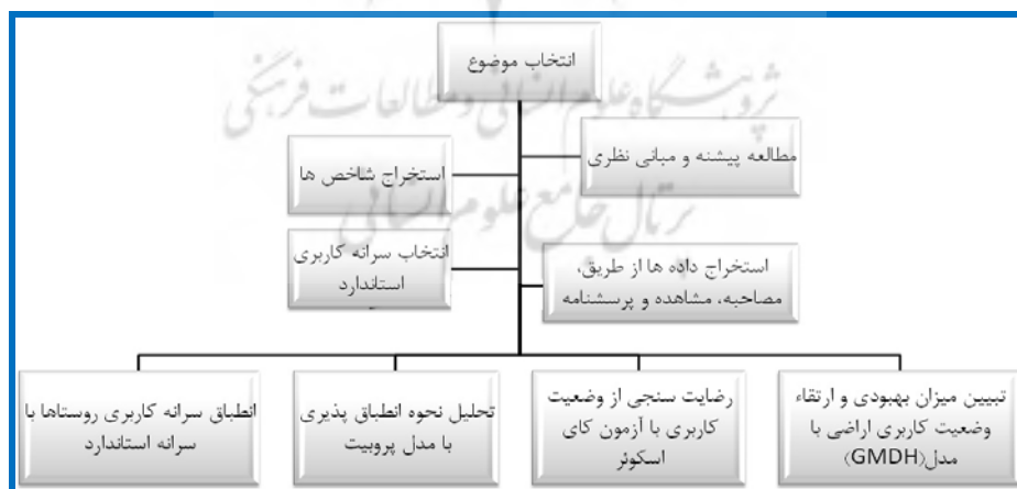
شکل ۱: مدل مفهومی تحقیق

روایی پرسش‌نامه بعد از مطالعه و بررسی کارشناسان و اساتید برنامه‌ریزی روستایی و طرح‌های، تایید گردید و پایایی پرسش‌نامه نیز با