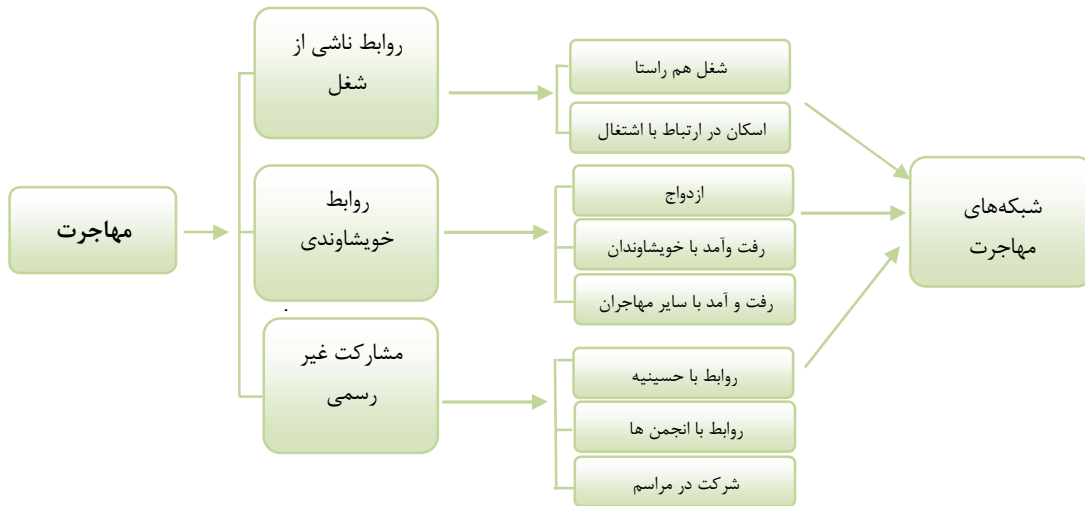
شکل ۱: مدل تحلیلی پژوهش