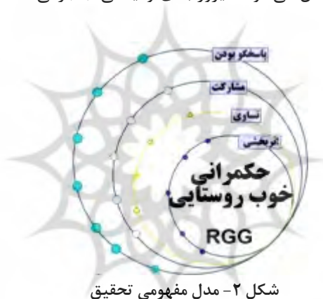
شکل ۲- مدل مفهومی تحقیق

رضایت به حالتی از موجود زنده گفته می‌شود که تمایلات محرک وی به هدف خود رسیده‌اند، یا می‌توان آن را احساسی دانست که شخص، هنگام رسیدن به آرزوهایش پیدا می‌کند (شعاری‌نژاد، ۱۳۷۵: ۳۶۱). رضایت، نیاز به ارضاکننده دارد که به پاداش یا هر گونه وضع یا اوضاع خارجی اطلاق می‌شود که به ارضا یا رضایت خاطر می‌انجامد. از دیدگاه جامعه‌شناختی، رضایت موجب افزایش مشروعیت نظام‌های اداری و پایداری آن‌ها می‌شود و از دیدگاه علم مدیریت، موضوع رضایت مشتری از اصول اساسی و اجتناب‌ناپذیر مدیریت کیفیت است و به همان نسبت، معیاری مهم در چارچوب مدل‌های تعالی سازمانی به شمار می‌رود. باید متوجه بود که سنجش رضایت مشتری برای همه‌ی سازمان‌ها یکسان نیست. در مورد سازمان‌های عمومی مانند دهیاری‌ها، که در بیشتر موارد رقیبی برای فعالیت آن‌ها وجود ندارد و امکان انتخاب برای مشتری نیست، مسأله‌ی رضایت تفاوت می‌یابد و سنجش آن به همان نسبت مشکل می‌شود (فیروزآبادی و ایمانی جاجرمی، ۱۳۹۱: ۷۰).