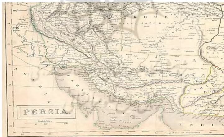
نقشه سال ۱۸۴۰ نقشه ایران که در سال ۱۸۴۰ برای اطلس بلاک بریتانیا تهیه و در لندن به طبع رسیده است . در این نقشه جزایر ابوموسی و تنب بزرگ به رنگ خاک ایران رنگ آمیزی شده است . نقشه مذکور در سال ۱۸۴۴ مجدداً برای اطلس یادشده تهیه و به طبع رسید. در این نقشه جزایر ابوموسی و تنب به رنگ خاک ایران رنگ آمیزی شده است .

د) نقشه ایران که در سال ۱۸۴۰ برای مؤسسه اطلس بلاک بریتانیا تهیه و در لندن چاپ شد. در این نقشه جزایر ابوموسی و تنب به رنگ خاک ایران رنگ‌آمیزی شده‌اند. در نقشه مذکور که دوباره در سال ۱۸۴۴ برای مؤسسه‌ی یادشده تهیه و چاپ شد، جزایر ابوموسی و تنب به رنگ خاک ایران رنگ‌آمیزی شده است.