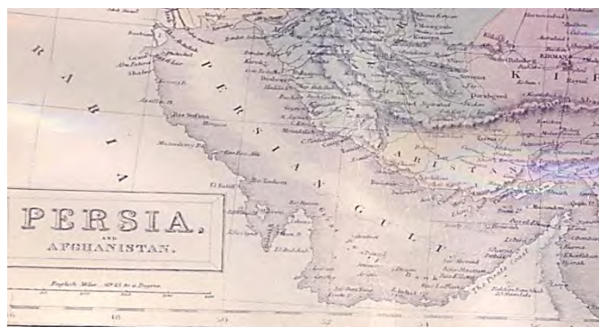
نقشه سال ۱۸۵۴ نقشه ایران که در سال ۱۸۵۴ به وسیله ای.بی.سی. بلاک در ادینبورو انگلیس به طبع رسیده است. در این نقشه جزایر تنب و ابوموسی به رنگ ساحل ایران رنگ‌آمیزی شده است.

ه) در نقشه «ایران و افغانستان» ۱ که در سال ۱۸۵۴ به وسیله بلاک در ادینبورو بریتانیا به طبع رسیده، جزایر تنب و ابوموسی به رنگ ساحل ایران رنگ‌آمیزی شده است.