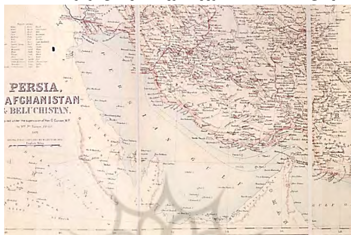
نقشه سال ۱۸۹۱ نقشه نیمه رسمی ایران، افغانستان و بلوچستان که در سال ۱۸۹۱ تحت نظارت لرد کرزن نایب‌السلطنه هند تهیه شد و در ۱۸۹۲ به چاپ رسیده است. در این نقشه جزایر تنب و ابوموسی به رنگ خاک ایران رنگ‌آمیزی شده است. اصل نقشه در اتاق نقشه کتابخانه دفتر هند در لندن موجود است.

ز) نقشه نیمه‌رسمی «ایران، افغانستان و بلوچستان» ۱ که در سال ۱۸۹۱ با نظارت لرد کرزن نایب‌السلطنه هند تهیه شد و در ۱۸۹۲ به چاپ رسید. در این نقشه جزایر تنب و ابوموسی به رنگ خاک ایران رنگ‌آمیزی شده‌اند. اصل نقشه در اتاق نقشه‌ی کتابخانه‌ی وزارت امور هند در لندن موجود است.