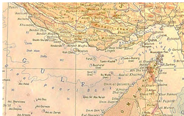
نقشه سال ۱۹۶۷ قسمت خلیج فارس نقشه رنگی ایران در اطلس جهانی که در سال ۱۹۶۷ به دستور شورای وزیران اتحاد شوروی به وسیله بخش اجرایی مصاحی و نقشه کشی به روسی و انگلیسی تهیه و علاوه بر رنگ آمیزی جزایر تنب و ابوموسی به خاک ایران. نام کشور ایران در کنار این جزایر درج گردیده است. اصل این نقشه و اطلس در اغلب کتابخانه های معتبر جهان از جمله کتابخانه ماسزوف در سازمان ملل متحد، نیویورک و وزارت امور خارجه آمریکا به مر دو زبان موجود است.

ط) نقشه شماره ۱۸، نقشه ۱۸۸۶ وزارت جنگ بریتانیا