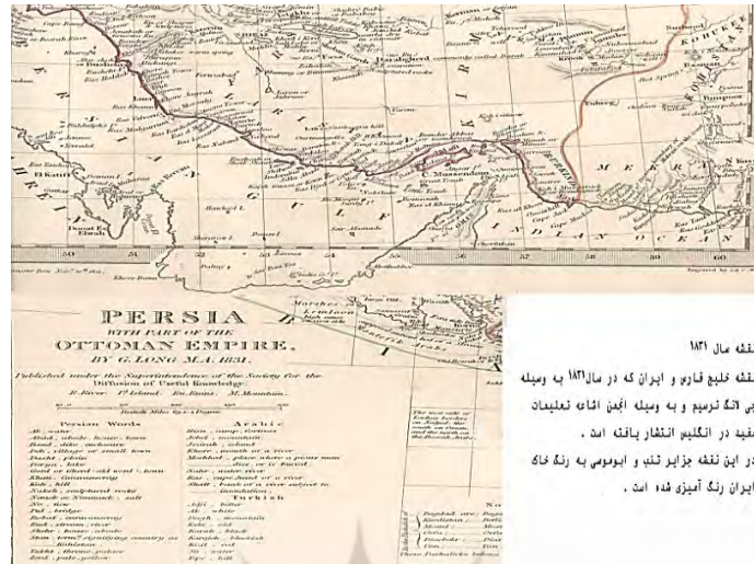
نقشه سال ۱۸۳۱ نقشه خلیج فارس و ایران که در سال ۱۸۳۱ به وسیله جی‌اچ‌لومیس و به وسیله آژن شاه‌علی‌خان مفید در انگلیس انتشار یافته است . در این نقشه جزایر تنب و ابوموسی به رنگ خاک ایران رنگ آمیزی شده است .

د) نقشه ایران که در سال ۱۸۴۰ برای مؤسسه اطلس بلاک بریتانیا تهیه و در لندن چاپ شد. در این نقشه جزایر ابوموسی و تنب به رنگ خاک ایران رنگ‌آمیزی شده‌اند. در نقشه مذکور که دوباره در سال ۱۸۴۴ برای مؤسسه‌ی یادشده تهیه و چاپ شد، جزایر ابوموسی و تنب به رنگ خاک ایران رنگ‌آمیزی شده است.