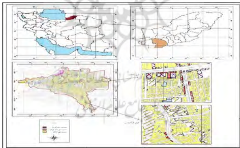
شکل ۲- نقشه موقعیت جغرافیایی نواحی مورد مطالعه در کشور و استان گلستان و شهر گرگان

شهرستان گرگان مرکز استان گلستان می‌باشد و در طول جغرافیایی ۵۴/۲۶ و عرض جغرافیایی ۵۰/۳۶ واقع شده است. ارتفاع شهر از سطح دریا ۱۶۰ متر است. از نظر طبیعی این شهرستان از دو منطقه کوهپایه‌ای و جلگه‌ای تشکیل شده که کوهپایه در قسمت جنوبی دشت گرگان است و مهم‌ترین قلل آن شاه کوه و شاهوار می‌باشد و قسمت جلگه‌ای در شمال و دنباله دشت گرگان است و مهم‌ترین رودهای این منطقه که به دریای خزر می‌ریزند رودهای گرگان، قره‌سو، کفش‌گیری و زیارت هستند. قابل ذکر است که شهر گرگان به دو منطقه و شش ناحیه و حدود ۱۰۰ محله تقسیم می‌گردد. مرز محلات همپوشانی پیچیده‌ای دارد که تفکیک آن‌ها از یکدیگر با دشواری‌های خاصی همراه است. لکن برای تشخیص تأثیر وضعیت اقتصادی ساکنان بر سرمایه‌ی اجتماعی و کیفیت زندگی آنان دو محله کاملاً متفاوت که هر کدام نماینده‌ی یک قشر عظیم از افراد جامعه می‌باشند، انتخاب شدند. محله گرگانپارس به‌عنوان نماینده‌ی مردم مرفه و گروه اغنیا و محله کوی انقلاب به‌عنوان نماینده مردم تهی‌دست و گروه کم درآمد جامعه معین شدند. قیمت مسکن و زمین در این دو محله، گویای تفاوت فاحش در سطح اقتصادی - اجتماعی ساکنان آن می‌باشد. در نقشه ذیل موقعیت جغرافیایی دو محله منتخب در شهر گرگان نسبت به استان گلستان و کشور ایران مشخص شده است.