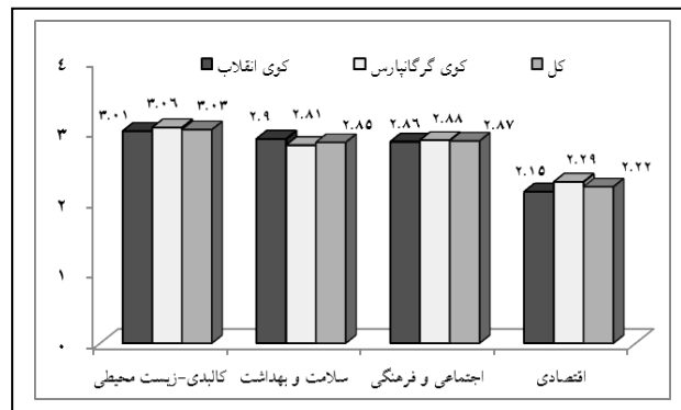
شکل ۴- سطح شاخص‌های کیفیت زندگی در سطح دو ناحیه