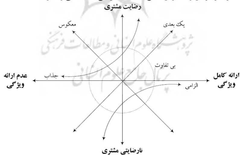
شکل ۳- مدل کانو (شاهین و صالح‌زاده، ۱۳۹۰: ۴)

دسته سوم خصوصیات کیفی در مدل کانو، خواسته‌های کیفی است که در زمان کاربرد محصول به عنوان یک نیاز و الزام از دید مشتری تلقی نمی‌گردد و در نتیجه برآورده نشدن آن‌ها، موجب نارضایتی مشتری نمی‌شود ولی ارائه آن‌ها در محصول، هیجان و رضایت بسیار بالایی را در مشتری پدید می‌آورد. تئوری الزامات انگیزشی، ارتباط بین عملکرد عینی به دست آمده از نگرش کیفیت رضایت‌مندی مشتریان را با در نظر گرفتن و بالا بردن سطح کیفیت نشان می‌دهد (فضلی و علیزاده، ۱۳۸۷: ۱۵۴).