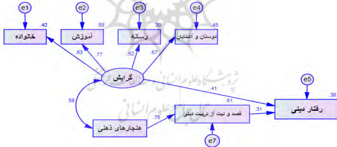
نمودار ۳- ضریب‌های رگرسیون استاندارد شده برای مدل مفهومی تحقیق

اما برای تحلیل عاملی تأییدی بر پایه‌ی معادله‌های ساختاری، در آغاز، برپایه‌ی مدل آیزن و فیش‌باین (نمودار شماره ۱)، مدل مفهومی تحقیق به صورت (نمودار شماره ۲) ترسیم و عملیاتی شد. چنان‌که دیده می‌شود، در این تحقیق، یک متغیر پنهان (گرایش به تربیت دینی) و سه متغیر مشاهده‌پذیر (هنجار‌ذهنی در مورد تربیت دینی، قصد و نیت از تربیت دینی و رفتار دینی) بر اساس مدل آیزن و فیش‌باین وجود دارد. از این‌رو، از میان این چهار متغیر، متغیری که به شکل مستقیم اندازه‌گیری نمی‌شد (متغیر پنهان)، برپایه‌ی چهار متغیر آشکار اندازه‌گیری شد. این متغیرهای آشکار برای گرایش به تربیت دینی شامل خانواده، آموزش، رسانه و دوستان و آشنایان بود که نتیجه‌ی مدل در نمودار شماره ۳، نشان داده شده است: