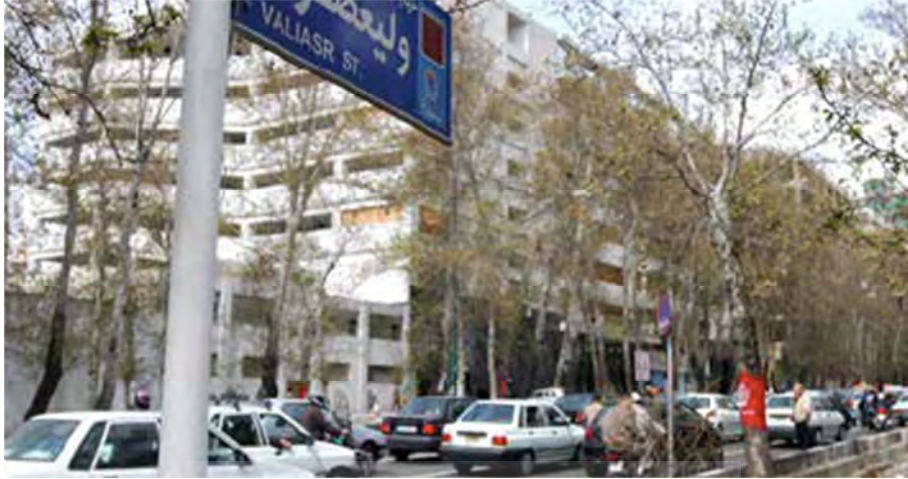
تصویر شماره ۲۳: خیابان ولیعصر در تهران (مینا ۱، درس شش: ۵۷)

بانک مدرسه دانشگاه ایستگاه مترو فروشگاه بیمارستان داروخانه پارک