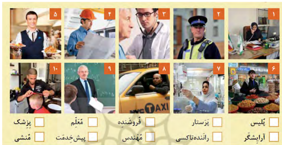
تصویر شماره ۲۳: مشاغل به زبان فارسی (مینا ۱، درس دو: ۱۵)

۲۲، ۲۶، ۳۲، ۳۷، ۴۰، ۴۵، ۴۶، ۵۳، ۵۷، ۵۹، ۶۲، ۷۳)، ضمن آن که تنها پاره‌ای محدود از این عکس‌ها قابلیت بازتاب صحنه‌هایی واقعی از جامعه‌ی ایرانی را دارا می‌باشند: