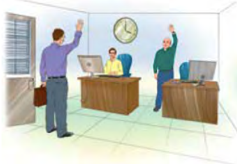
تصویر شماره ۱۷: زبان بدن، ایما و اشاره (مینا ۱، درس دو: ۱۲)

مثال فوق نمونه‌ای دیگر از به‌کارگیری زبان بدن، برای کنش‌گفتاری «خداحافظی» را نشان می‌دهد.