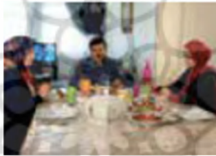
تصویر شماره ۱۸: فاصله اجتماعی میان افراد (مینا ۱، درس هشت: ۷۳)

مثال فوق نمونه‌ای دیگر از به‌کارگیری زبان بدن، برای کنش‌گفتاری «خداحافظی» را نشان می‌دهد.