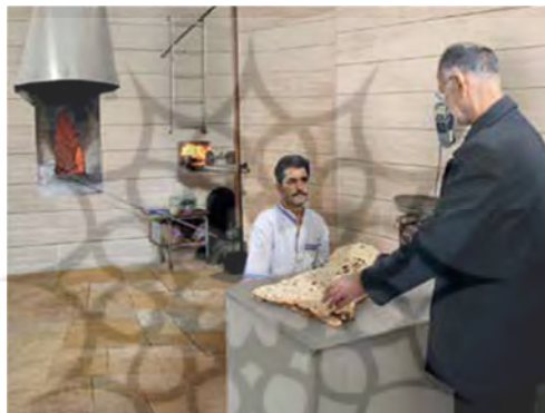
تصویر شماره ۲۶: در نانوائی (مینا ۱، درس شش: ۵۳)

عکس‌ها علاوه بر به روز بودن، مردم را در مکان‌ها و شرایط گوناگون زندگی روزمره به تصویر می‌کشند؛ مانند: به همراه داشتن لیست خرید و تهیه مواد غذایی در سوپرمارکتی در ایران، خرید نان در نانوائی (نک همچنین: تصاویر شماره ۲، ۶، ۷، ۹، ۱۸، ۲۱، ۲۴).