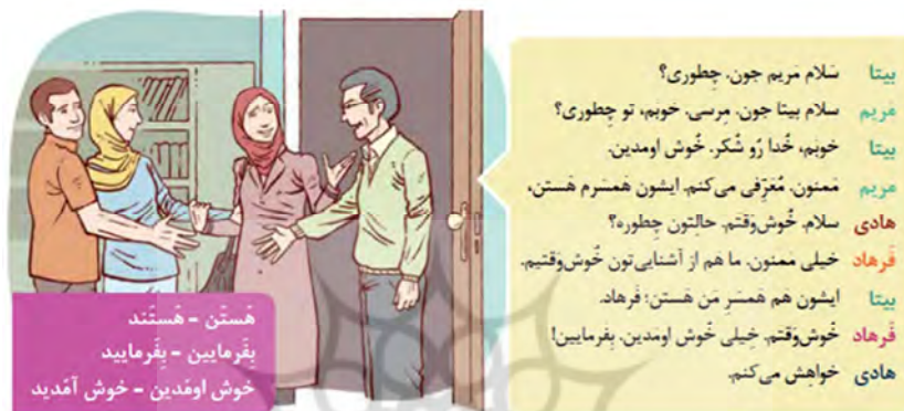
تصویر شماره ۷: سپاسگزاری (مینا ۱، درس دو: ۱۱)

در این مکالمه شاهد به کارگیری عبارات‌های مرسوم برای کنش گفتاری «سپاسگزاری» در گفتگوهای معمول و روزمره در ایران هستیم؛ برای نمونه: «مرسی»، «ممنون» و «خیلی ممنون».