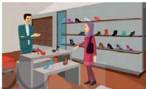
تصویر شماره ۹: تقاضا کردن دادن (مینا ۱، درس شش: ۵۴)

تینا: ببخشید آقا، قیمت این کفش چه‌قده؟ فروشنده: ۸۰ هزار تومن. تینا: کفش ارزون‌تر نداری؟ فروشنده: کفش‌های اون ویترون ارزون‌ترن. تینا: ببخشید آقا اون کفش داخل ویترونو می‌خوام. فروشنده: کدومو؟ تینا: این قهوه‌ایه رو. فروشنده: چه سایزی؟ تینا: ۳۷ لطفاً. فروشنده: بفرمایین.