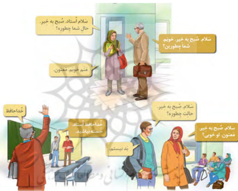
تصویر شماره ۲: سلام و احوالپرسی دوستانه و مؤدبانه (مینا ۱، درس یک: ۴)

تصویر بالا کنش‌گفتاری «سلام و احوالپرسی» و نحوه استفاده از آن در زندگی روزمره در ایران را بخوبی نشان می‌دهد؛ برای نمونه: «سلام»، «صبح بخیر»، «خداحافظ»، «حالت چطوره؟»، «شما چطورین؟»، «ممنون، تو خوبی؟» و «منم خوبم» و غیره).