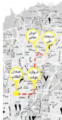
تصویر شماره ۸: دستور دادن (مینا ۱، درس هفت: ۶۵)