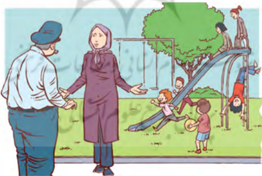
تصویر شماره ۱۹: فاصله اجتماعی میان افراد (مینا ۱، درس چهار: ۳۱)