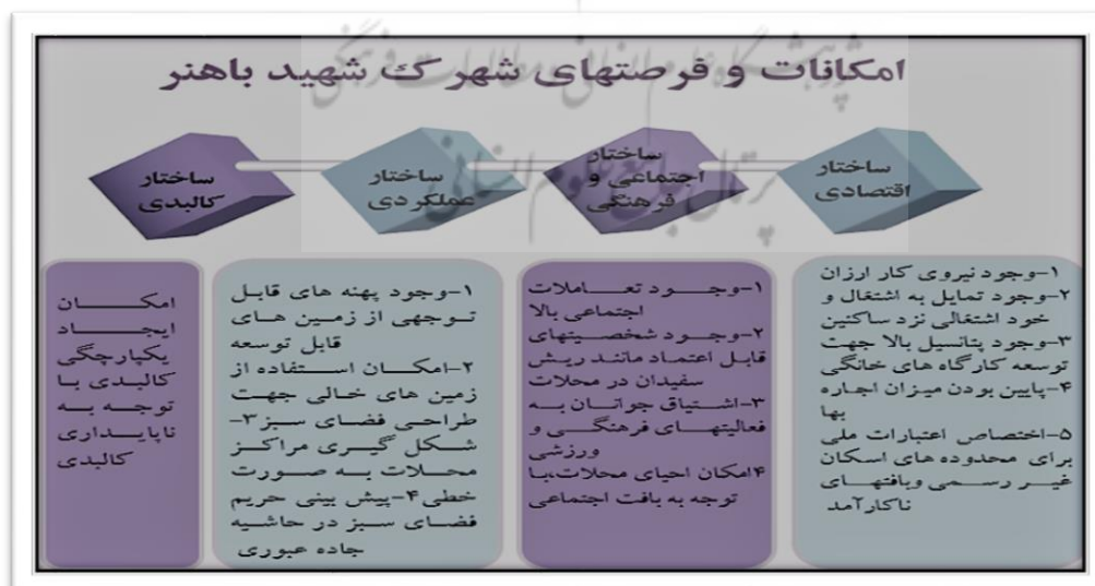
شکل ۳- امکانات و فرصت های شهرک شهید باهنر

عدم توجه به پتانسیل هایی چون پیشینه روستایی شهرک شهید باهنر و امکان فرصت ایجاد شغل برای ساکنین به صورت کشاورزی شهری و طراحی فضای گردشگری در ورودی جاده سرخس به صورت سایت گردشگری -سنتی مشهد به شکل بوم گردی های روستایی و حفظ کالبد شهرک به صورت پروژه روستا- شهری در شهرک باهنر و امتیاز نزدیکی این پروژه به حرم امام رضا (ع) و فرودگاه هاشمی نژاد از دیگر کاستی های طرح حاضر در معرفی امکانات و پتانسیل های شهرک شهید باهنر می باشد. طبق تصویر شماره ۳، فرصت ها و پتانسیل های بررسی شده توسط مشاور در طرح تفصیلی شهرک شهید باهنر به صورت کاملاً مختصر و اجمالی و بدون توجه به نادیده گرفته شدن نقش و رسمیت نداشتن شهرک شهید باهنر در طرح جامع مشهد مورد مطالعه قرار گرفته است.