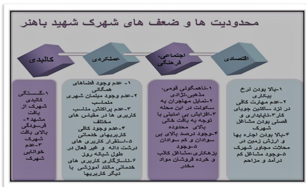
شکل ۲- محدودیت ها و ضعف های شهرک شهید باهنر

عدم توجه به پتانسیل هایی چون پیشینه روستایی شهرک شهید باهنر و امکان فرصت ایجاد شغل برای ساکنین به صورت کشاورزی شهری و طراحی فضای گردشگری در ورودی جاده سرخس به صورت سایت گردشگری -سنتی مشهد به شکل بوم گردی های روستایی و حفظ کالبد شهرک به صورت پروژه روستا- شهری در شهرک باهنر و امتیاز نزدیکی این پروژه به حرم امام رضا (ع) و فرودگاه هاشمی نژاد از دیگر کاستی های طرح حاضر در معرفی امکانات و پتانسیل های شهرک شهید باهنر می باشد. طبق تصویر شماره ۳، فرصت ها و پتانسیل های بررسی شده توسط مشاور در طرح تفصیلی شهرک شهید باهنر به صورت کاملاً مختصر و اجمالی و بدون توجه به نادیده گرفته شدن نقش و رسمیت نداشتن شهرک شهید باهنر در طرح جامع مشهد مورد مطالعه قرار گرفته است.