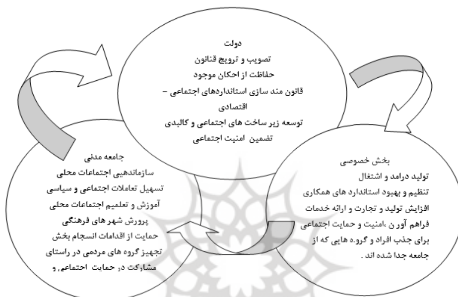
شکل ۱. ارتباط و وظایف دولت، بخش خصوصی و جامعه مدنی در مدل حکمریوایی

حکمریوایی شهری، فرایندی است چند جانبه میان کنشگران رسمی اداره شهر از یک طرف و نیز فعالان عرصه مدنی به عنوان کنشگران غیر رسمی که تعاملات چند وجهی آنها می تواند به سازگاری منافع گوناگون در بین کنشگران منجر شود. آنچه در این مفهوم باز نمود دارد، همانا وارد شدن جامعه مدنی و نیز بخش خصوصی به فرایند برنامه ریزی و اداره امور (شهری) است (رهنما و دیگران، ۱۳۸۹: ۲۰۴). در این میان دولت یکی از کنشگران است و دیگر عوامل دخیل در حکمریوایی، بسته به سطح مورد بحث، مختلف هستند. همان طور که در نمودار شماره ۱ نشان داده شده است، این عامل می تواند در سطح اقشار مختلف یا سازمان های گوناگون تعریف شود.