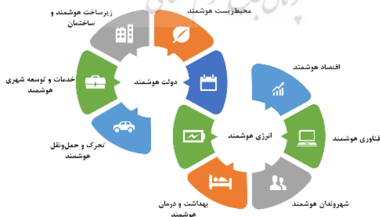
شکل ۱. مؤلفه‌های شهر هوشمند

با توجه به اینکه هر شهری بسته به امکانات، فناوری‌های موجود، فرهنگ و موجودیت خود دارای مؤلفه‌های گوناگونی است، لذا پژوهش‌های پیشین هرکدام مؤلفه‌های گوناگونی را برای یک شهر هوشمند در نظر گرفته‌اند. هر ترکیبی از اجزای مختلف هوشمند می‌تواند شهرها را هوشمند سازد. یک شهر نیازی به داشتن همه مؤلفه‌ها برای هوشمند شدن، ندارد. تعداد مؤلفه‌های هوشمند بستگی به هزینه و فناوری موجود دارد. شهرهای هوشمند مختلف، بسته به تمرکز آن‌ها در زمینه‌های گوناگون، دارای سطح متفاوتی از این مؤلفه‌های هوشمند هستند. با توجه به متفاوت بودن مؤلفه‌های شهر هوشمند در مقالات متعدد با کمک پویا محیطی، در این مطالعه یک دسته‌بندی کلی از مؤلفه‌های شهرهای هوشمند جمع‌آوری شده است. داده‌های جدول (۳) در پس‌نگری مورد استفاده قرار می‌گیرد. همچنین در شکل ۱ نمایی از مؤلفه‌های شهرهای هوشمند را مشاهده می‌کنید.