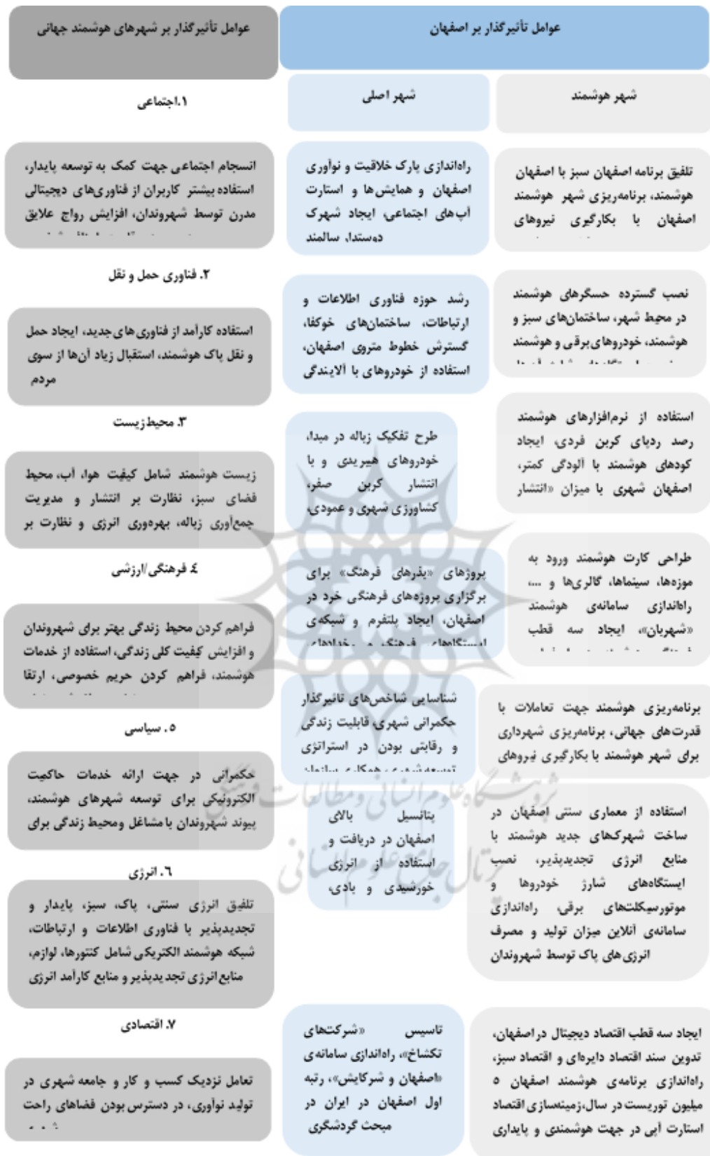
شکل ۸. تجزیه و تحلیل مقایسه‌ای از عوامل مؤثر بر توسعه شهرهای هوشمند در سراسر جهان در مقابل شهر هوشمند اصفهان