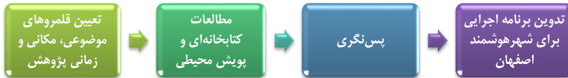
شکل ۳. مراحل اجرای تحقیق

در این بخش به توضیح روش‌های مورد استفاده در این تحقیق پرداخته می‌شود. شکل ۳ نیز مراحل اجرای این تحقیق را نشان می‌دهد. در ادامه به توضیح مختصری از هر مرحله خواهیم پرداخت.