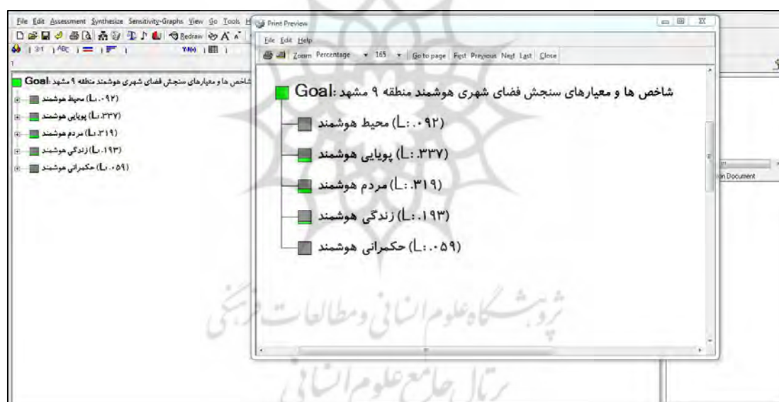
شکل ۱. امتیاز شاخص‌های فضای شهری هوشمند

با توجه به امتیاز کارشناسان به معیارهای کلی و زیر معیارهای انتخابی برای اولویت‌بندی شاخص‌های مؤثر در تأثیر هوشمند سازی با تأکید بر زیست پذیری شهرها در منطقه ۹ شهرداری مشهد، پس از به دست آمدن امتیازها میانگین امتیاز کارشناسان وارد نرم‌افزار می‌شود و معیارها نسبت به هم امتیازدهی می‌شوند. امتیاز معیارهای به دست آمده بر اساس نظرات کارشناسان به شرح شکل (۱ و ۲) می‌باشد. همچنین جدول ۳، اولویت‌بندی شاخص‌های مؤثر در هوشمندسازی منطقه ۹ شهر مشهد را نشان می‌دهد.