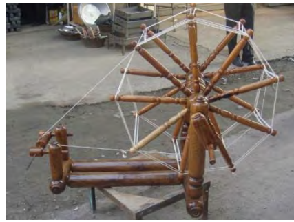
شکل ۸: چرخ نخریسی، اثر عبدالرحیم فروتن