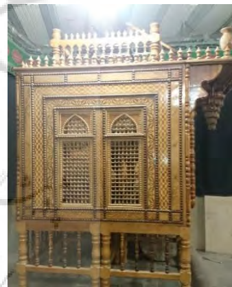
شکل ۶ و ۷: شیدونه (شهیدانه)، اثر عبدالرحیم فروتن