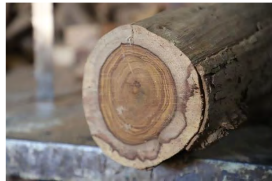
شکل ۳: برش عرضی چوب جگ (روش سنتی)