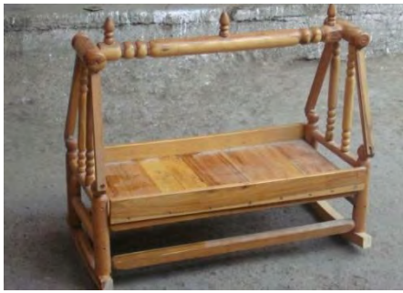
شکل ۹: گهواره، اثر عبدالرحیم فروتن