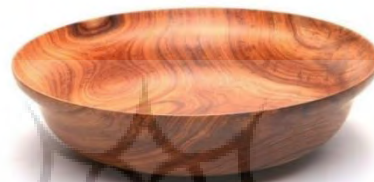
شکل ۵: ظرف چوبی با ضخامت ۲ میلی‌متر، اثر عبدالرحیم فروتن