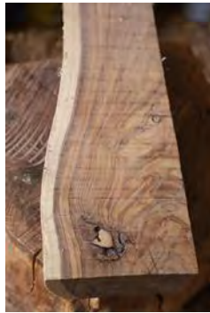
شکل ۴: برش طولی چوب جگ

متداول، گونه‌ای از سنت شکنی و همراهی با دوران معاصر محسوب می‌شود که مقوله‌ی روح زمانه‌ی مورد نظر داتن را به ذهن متبادر می‌سازد.