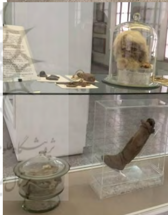
تصویر ۹: مرد نمکی، موزه ایران باستان