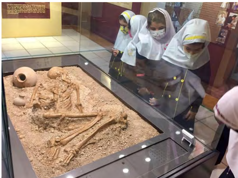
تصویر شماره ۲: اسکلت زن جوان با قدمت ۳۲۰۰ سال - موزه بابل

طبقه اول، شامل آثار شاهکار تمدنهای کهن جامخانه نکا، گنبد کابوس گرگان، گوهر تپه بهشهر، بابل و... می باشد. طبقه زیرزمین، به بخش مردم شناسی استان مازندران اختصاص دارد.