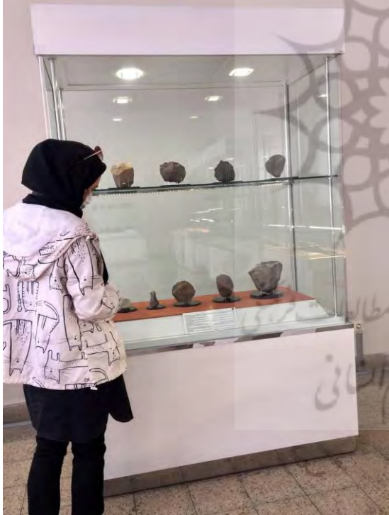
تصاویر شماره ۶ و ۷: تالار طبقه همکف موزه ایران باستان (نگارنده)