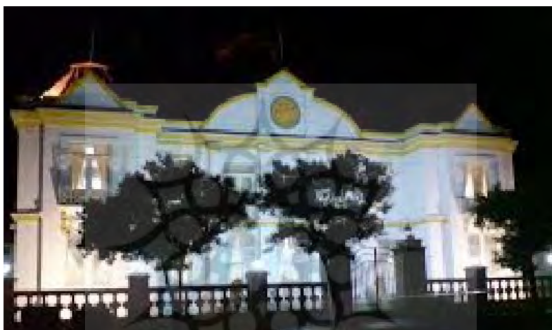
عکس شماره ۱: موزه بابل

موزه بابل با احتساب زیرزمین، دارای سه طبقه است. این مکان در سال ۱۳۰۷ شمسی به عنوان شهرداری (بلدیه) بنا شد بود. در سال ۱۳۷۴ شمسی با کاربری فرهنگی در اختیار میراث فرهنگی مازندران قرار گرفت و پس از احیاء، مرمت و بازپیرایی در بهمن ماه ۱۳۷۵ به عنوان موزه بابل گشایش یافت.