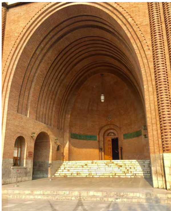
تصویر شماره ۳: سر در موزه ایران باستان - تهران

این موزه مهم‌ترین موزه کشور در خصوص نگهداری، نمایش و پژوهش مجموعه‌های باستان‌شناختی ایران است. گستردگی و تنوع مجموعه اشیاء موجود در موزه به گستردگی جغرافیایی کشور و دوران‌های متعدد پیش از تاریخی، تاریخی و اسلامی است که انسان در این سرزمین زیسته و آثاری از خود بجای نهاده است. در حال حاضر موزه ملی به نمایش آثاری پرداخته که بیانگر غنای فرهنگ و تمدن، هنر، رشد اقتصادی و دست‌آوردهای فناوری ایرانیان است. «ساختمان موزه در دو بخش نمایشگاهی و پژوهشی به طور مجزا طراحی شده است. بخش نمایشگاهی دارای دو اشکوب و یک طبقه زیرزمین، برای انبار است. تالارهای موقت نمایشگاه‌های موقت، کتابخانه و تالار سخنرانی نیز در این بخش قرار دارد. تأسیسات رفاهی، متناسب با فعالیت موزه محاسبه شده است. نور ساختمان بطور طبیعی و با نیروی الکتریسیته تأمین شده است. برای نورگیری طبیعی پنجره‌های بلند در دو ضلع شرقی و غربی تالارها، تعبیه و دو حیاطی خلوت یا پاسیوی مرکزی در میان تالارها منظور شده است. دستگاه گرم کن مرکزی برای گرم کردنی تالارها و همچنین، پنکه‌های بزرگ سقفی، علاوه بر پنجره‌ها، برای تهویه داخل تالارها نصب شده است» (نفیسی، ۱۳۸۰: ۱۶). در طبقه اول موزه ایران باستان، شامل دو بخش «پیش‌از تاریخ ایران» با آثاری از دوران پارینه‌سنگی قدیم تا اواخر هزاره چهارم پیش از میلاد (یعنی از کهن‌ترین دوران تا پیش از ابداع نگارش) و «دوران تاریخی» با آثاری از اواخر هزاره چهارم پیش از میلاد (یعنی آغاز به‌کارگیری نگارش) تا پایان دوره ساسانی است.