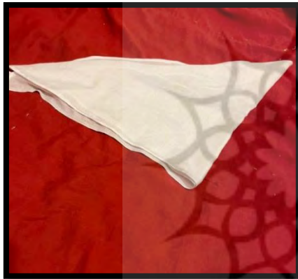
تصویر ۱. ته سرو

– ته سرو: سیرجانی‌ها به ملاح «شیردون» می‌گویند و از آنجا که این قسمت سر