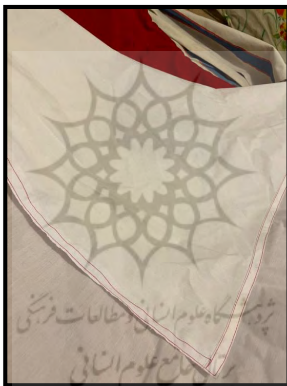
تصویر ۱۰. قلطونو

بستن یا قنداق کردن نوزاد در گذشته بسیار متداول بود چنان که گاه بچه‌ها را تا یک سال و نیم یا حتی دو سال می‌بستند. برای قنداق کردن بچه‌ها، ابتدا به سارغو نیاز بود که پارچه‌ای با مترای ۱ در ۱ ۱ بود و یک بالشتک به نام قلطونو ۲ در اندازه ۲۰ در ۲۰ سانتی‌متر که بین دو لایه سارغ قرار می‌دادند تا از سر و گردن بچه محافظت کند. قلطونو همیشه با معلوج ۳ پر می‌شد و روکش آن پارچه‌ای نخی و خنک بود. (تصاویر ۹ و ۱۰)