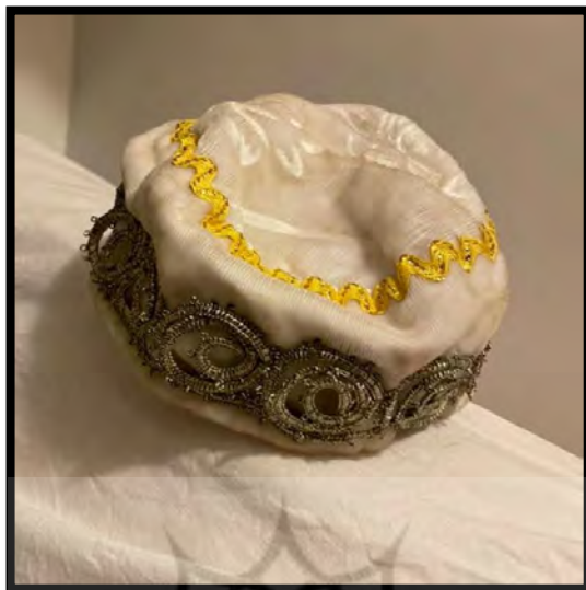
تصویر ۶. تاجو یا کلاه ساده