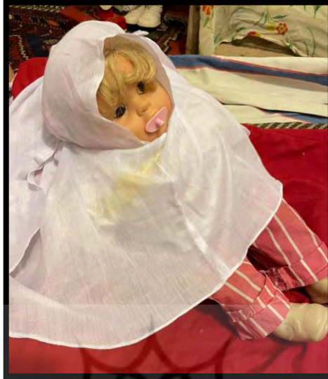
تصویر ۲. کلوته یا مقنعه

- دور گوشو، رو سرو: پس از پوشاندن سر با کلوته، نوبت به بستن سر بچه با دور گوشو، لچک یا رو سرو ۱ می شد که آن هم از جنس پارچه کلوته و ته سرو بود و اغلب به رنگ سفید انتخاب می شد. انتخاب رنگها و حتی جنس پارچهها سلیقه‌ای بود اما گاه در بین چند عدد روسری، یک روسری گلدار هم دیده نمی شد. (تصویر ۳)