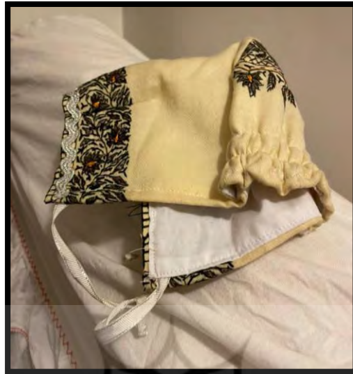
تصویر ۸. کلاه گوشو