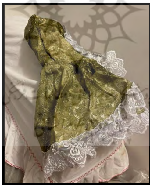
تصویر ۷. کلاه چینو