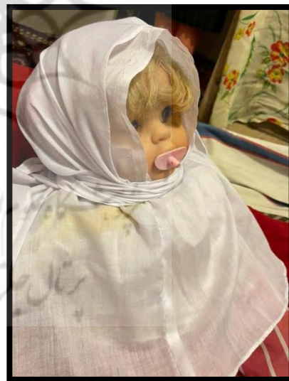
تصویر ۳. دور گوشو یا روسری

- دستمال: بعد از این، نوبت به بستن پیشانی نوزاد می رسید که برای آن هم دستمال کوچکی تهیه می شد که انتخاب