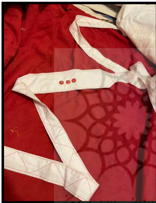
تصویر ۹. سارغو

- لباس رو و آخرین پوشش نوزاد: به گُت نوزاد «یل» می گفتند و آن را به طور معمول بعد از قنطاق کردن می پوشانند. تنها لباس نوزاد بود که به طور کامل مشخص