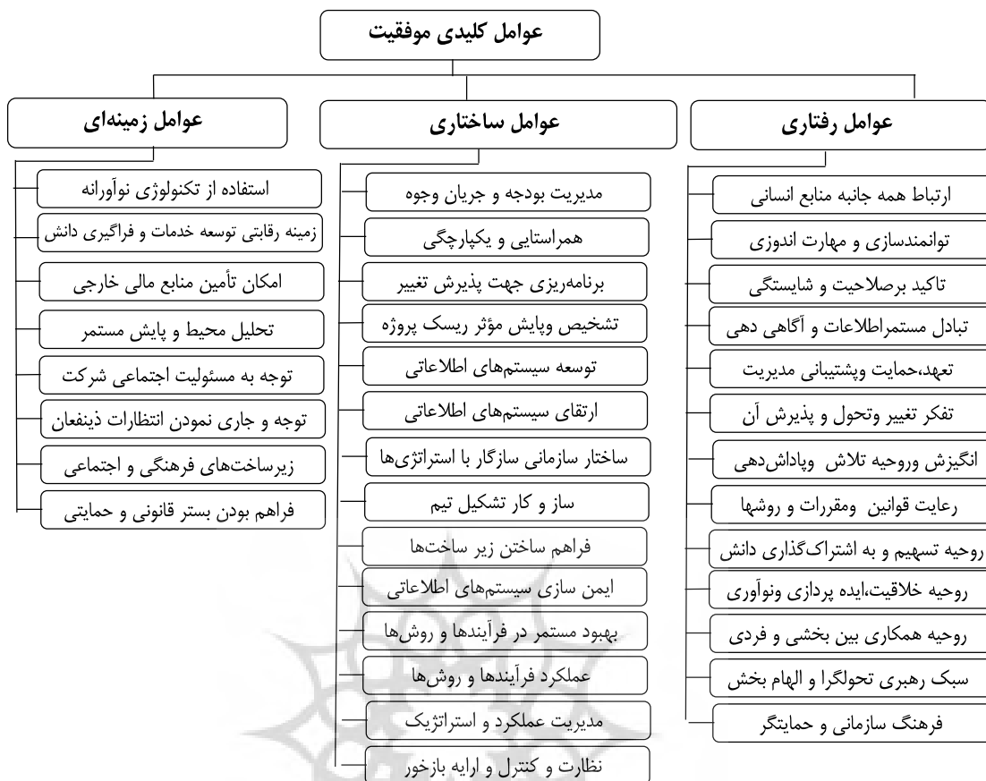
شکل ۲. مدل نهایی عوامل کلیدی موفقیت نظام حسابرسی داخلی