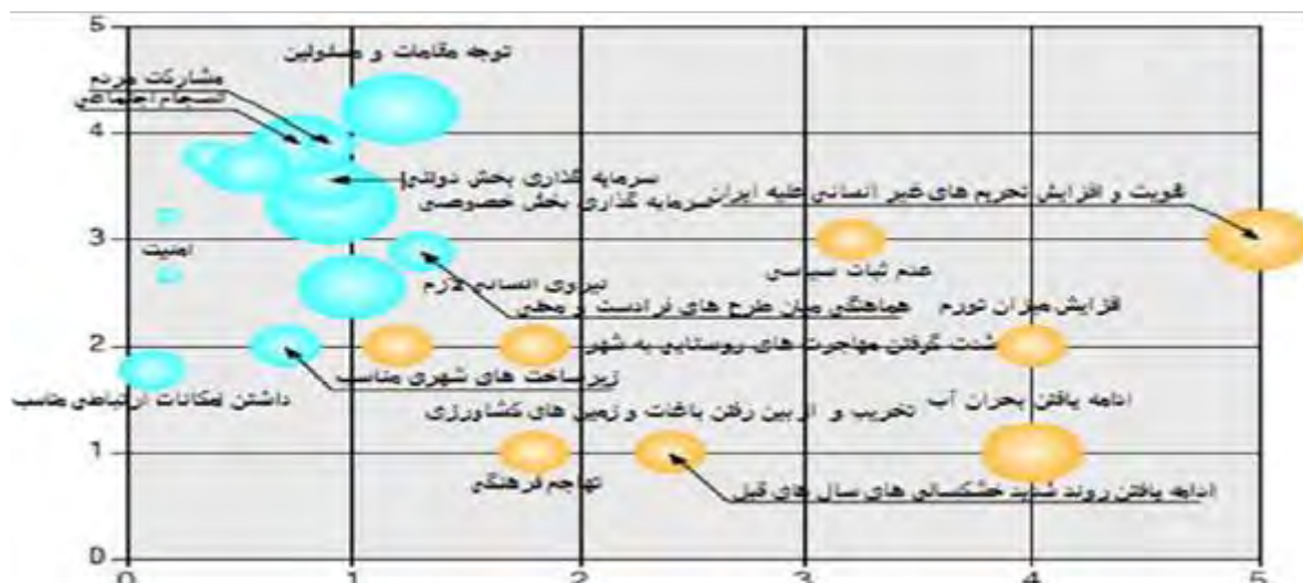
شکل شماره ۴. نقشه راهبردی مدیریت شهری در سکونتگاه های غیررسمی

بر اساس این نقشه راهبردی در بین عوامل ضروری در سکونتگاه های غیررسمی شهر پاکدشت، برنامه ریزی راهبردی و توجه مقامات و مسئولان مدیریتی در رتبه اول قرارداد، در واقع، بر اساس توزیع بودجه سالانه این شهر، مشارکت مردم و انسجام اجتماعی، عاملی ضروری است چراکه، امتیاز زیادی را به خود تخصیص داده است. این موضوع در سال های اخیر به علت برخی مشکلات از قبیل استفاده از مدیران غیربومی و عدم پاسخگویی مسئولان و شهروندان نسبت به امور شهر بوده است. یکی از مقدمات توسعه در شهر، داشتن برنامه ریزی منسجم است و شهر پاکدشت نیز از این قانون مستثنی نیست. از دیگر عوامل که باید توجه خاصی بدان شود، استفاده از همه پتانسیل های مدیریت شهری است. توانایی های مدیریتی به درستی بهره برداری نشده است. گام بعد که با توجه به اندازه حباب آن از ضرورت زیادی برخوردار است. سرمایه گذاری های بخش دولتی و خصوصی در سکونتگاه های غیررسمی است. در این بین، عوامل کلان محیطی که باید به آن توجه ویژه ای شود. به خاطر وجود تحریم های سیاسی و غیرانسانی سبب کم شدن معیشت افراد و افزایش میزان تورم شده و همین عامل باعث مهاجرت روستائیان به شهرها، تفکیک غیرمجاز زمین های کشاورزی توسط سودجویان و ساخت وسازهای غیرمجاز است. در نهایت برای توانمندسازی و ساماندهی سکونتگاه های غیررسمی در پاکدشت به ارائه راهکارهای مدیریتی پرداخته شده است.