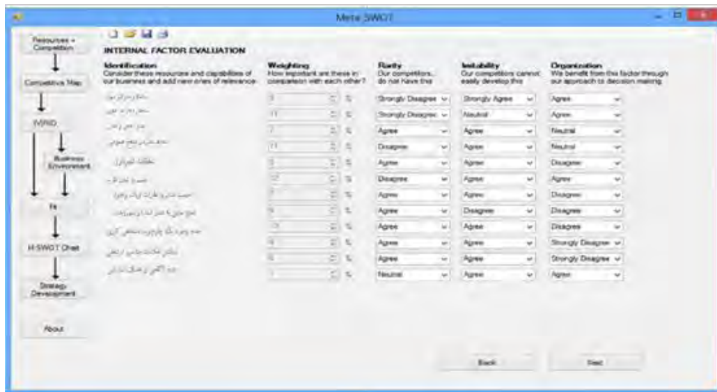
شکل شماره ۳. ارزیابی آسیب‌های مدیریت شهری بر اساس دیدگاه مبتنی بر منابع

در مرحله بعدی عوامل بیرونی تأثیرگذار در دستیابی به اهداف را با کمک گروه خبرگان شناسایی کرده و سپس میزان ایستایی و پویایی، میزان تأثیرگذاری، احتمال افزایش و درجه اضطراب بودن عوامل بیرونی شناسایی شده را مورد ارزیابی قرار دادیم. نتایج حاصل از این مراحل در (جدول ۶) قابل مشاهده است.