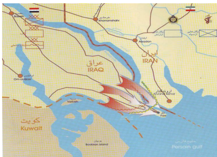
شکل شماره ۱: موقعیت عملیات پدافندی فاو

لذا، در بیشتر عملیات های پدافندی مثل عملیات پدافندی خرمشهر، پدافندی فاو، پدافند در امتداد کارون، پدافند پای پل کرخه، پدافند در امتداد هورالعظیم و امتداد شادگان، رودخانه های اروند، کارون، هورالعظیم و شادگان و .. در مانو و تهاجم طرفین، تامین، صرفه جویی قوا، غافلگیری، هدف و سادگی تاثیرگذار بوده اند. عبور از رودخانه کارون در عملیات بیت المقدس و تهاجم از شرق به غرب در جناح دشمن بر خلاف تصور طراحان جنگی عراق، طرح و اجرای عبور از رودخانه خروشان اروند در فتح فاو، نمونه هایی از غافلگیری در طرح ریزی و تاکتیک جنگ های معاصر است.