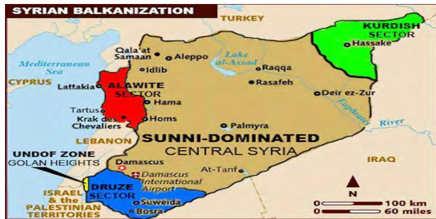
نقشه ۱: موقعیت پایگاه نظامی روسیه در طرطوس، (مأخذ: اسمعیل پورروشن، ۱۳۹۶: ۲۳۸)