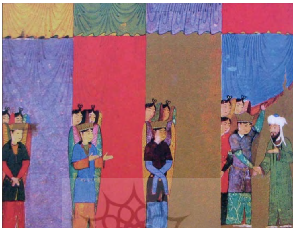
تصویر ۲. نگاره هفتاد هزار پرده، معراج‌نامه شاهرخی. (۸۴۰ ه.ق./۱۴۳۶ م.). (سگای، ۱۳۸۵: ۱۰۴)