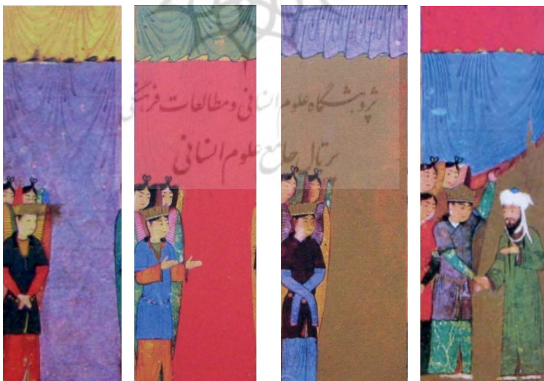
تصویر ۵ و ۶. (از راست به چپ) بخشی از نگاره هفتاد هزار پرده، معراج‌نامه شاهرخی. (سگای، ۱۳۸۵: ۱۰۴)