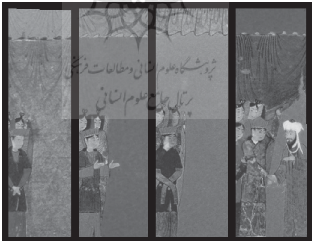
تصویر ۱. تقسیم‌بندی چهارگانه در نگاره هفتاد هزار پرده. (سگای، ۱۳۸۵: ۱۰۴)

در قرآن کریم به حجاب اشاره شده است که خداوند آن را حائلی میان خود و بندگانی قرار داده است که نفس خود را معبود خویش قرار داده‌اند. «خداوند بر دل‌های آنان و بر شنوایی ایشان مَهْر نهاده و بر دیدگان‌شان پرده‌ای و آنان را عذابی بزرگ است» (بقره/ آیه ۷). «پس آیا دیدی کسی را که هوس خویش را معبود خود قرار داده و خدا او را دانسته گمراه گردانیده و بر گوش و دلش مَهْر زده و بر دیده‌اش پرده نهاده است؟ آیا پس از خدا چه کسی او را هدایت خواهد کرد؟ آیا پند نمی‌گیرید؟» (جاثیه/ آیه ۲۳). «و چون قرآن بخوانی، میان تو و کسانی که به آخرت ایمان ندارند پرده‌ای پوشیده قرار می‌دهیم» (اسراء/ آیه ۴۵). در واقع حجاب موانعی است که دیده بنده را از دیدار جمال