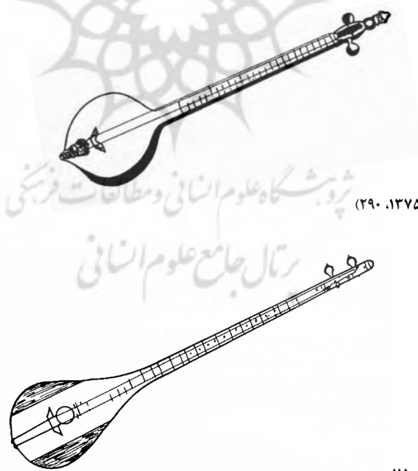
تصویر ۱. تنبوری بغدادی. (فارابی، ۱۳۷۵، ۲۹۰)

فارابی در «مقاله دوم از فنّ دوم» کتاب الموسیقی الکبیر در پی آنچه در مورد عود پرداخته بود به شرح ساز تنبور می‌پردازد که بر دو قسم است: اینک به دنبال آنچه در باب عود بیان داشتیم، در مورد سازهایی که با آن تجانس دارند سخن می‌گوییم. مجانس‌ترین ساز با عود، سازی است که به تنبور معروف است، زیرا در این ساز نیز نغمه‌ها از بخش‌های مختلف تارهای موجود در آن بر می‌خیزند. همچنین، شهرت این ساز در نزد عامه تقریباً همانند شهرت عود است، و ایشان با تنبور نیز مانند عود، خوی و الفت دارند... در این شهر که ما کتاب خود را در آن تألیف