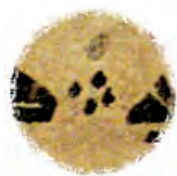
تصویر ۸. نشان ختم آیات به صورت چهار نقطه سیاه، مشهد، کتابخانه آستان قدس رضوی، ش ۷۹.

از دیگر ویژگی‌های منحصر به فرد قرآن‌های این سبک، شیوه خاص تفکیک آیات است؛ در حالی که تقریباً تمامی قرآن‌های کوفی شرقی از علائم تذهیب برای تفکیک آیات استفاده شده است، در این سبک از چهار نقطه سیاه برای تفکیک آیات استفاده شده است. این روش را کاتبان قرآن‌های سبک حجازی در سده نخست هجری به کار می‌بردند و صورت تکامل یافته‌اش در قالب نقطه‌های مدور زرین در قرآن‌های کوفی اولیه دیده می‌شود (تصویر ۸).