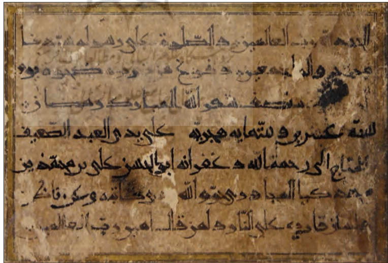
تصویر ۱۰ - رقم ابوالحسن علی بن محمد بن محمدکیا مجاوری، مورخ ۶۲۰، مشهد، کتابخانه آستان قدس رضوی، ش ۸۴.

هرچند نیک می‌دانیم نسبت یک کاتب به منطقه‌ای خاص به‌تنهایی نمی‌تواند دلیلی قطعی بر فعالیتش در همان منطقه باشد. وقتی تعدادی کاتب