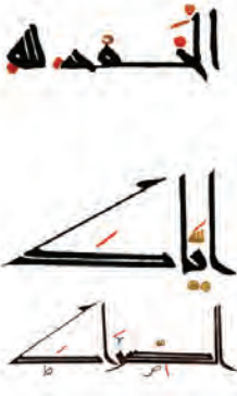
تصویر ۲ - حروف کشیده ساده (بالا) و مضاعف (پایین).

- شکل حروف کشیده: در قلم کوفی شرقی نیز، مانند هر قلم دیگری، ممکن است برخی حروف به اقتضای ترکیب سطر، کشیده نوشته شود؛ اما در کوفی شرقی دو نوع حروف کشیده وجود دارد: کشیده‌های مضاعف، که عبارت است از حروفی چون «ک»، «ص» و «ط»، که دو خط افقی ضخیم بر روی یک‌دیگر قرار می‌گیرد و قدرت بصری بیشتری دارد. دیگر کشیده‌های ساده که با یک خط افقی ضخیم ساخته می‌شود (تصویر ۲).