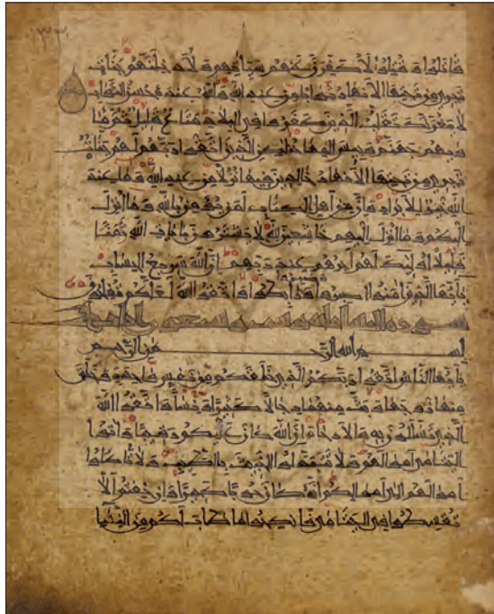
تصویر ۹ - برگه از قرآن مسعود بن عیسی مقری دیلمی، مشهد، مورخ ۶۴۷ یا ۶۴۹ ق.، مشهد، کتابخانه آستان قدس رضوی، ش ۷۸.

دیگر نسخه قرآنی است به خط علی بن حسین صفار مورخ به ۳۸۳ ق. (استانبول، کتابخانه کاخ توپقاپی، ش 22 HS) که خطی منقح‌تر از نمونه قبل دارد و نشان‌دهنده تکامل این سبک در ربع آخر سده چهارم هجری است. دیگر نسخه‌ها مورخ سده پنجم تا هفتم هجری است. اثر متأخر این سبک، قرآنی است جامع به خط مسعود بن عیسی بن شعیب مقری دیلمی رودباری مورخ ۶۴۷ یا ۶۴۹ ق. ۷ (مشهد، کتابخانه آستان قدس رضوی، ش ۷۸). این کاتب نیز نسبت دیلمی و رودباری دارد که هر دو به شمال ایران مربوط است. به علاوه درمی‌یابیم این سبک از میانه سده چهارم تا میانه سده هفتم رواج داشته است و تاریخی دست‌کم ۳۰۰ ساله برای آن می‌توان تصور کرد.