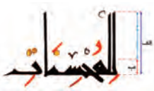
تصویر ۳ - ارتفاع سطر در کوفی شرقی از طریق تقسیم فاصله کرسی صدر (الف) بر کرسی دوم تا کرسی اصلی (ب) به دست می‌آید

با ارزیابی این مؤلفه‌ها بر حدود ۱۶۰ نسخه قرآن کوفی شرقی در نهایت دوازده سبک اصلی مشخص شد که البته برخی از آنها به زیرگروه‌های فرعی تقسیم می‌شود. در مجموع ۲۹ سبک اصلی و فرعی به دست آمد که یکی از مهم‌ترین آنها سبکی است که بر مبنای اطلاعات فرعی دیگر، مانند نسبت