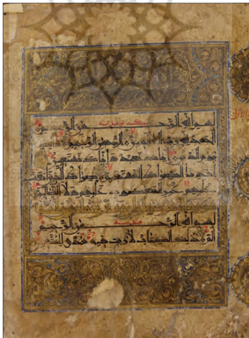
تصویر ۷ - صفحه افتتاح قرآن ابوالحسن محمدکیا مجاوری، تذهیب ساده با رنگ اخراپی و لاجوردی، مشهد، آستان قدس رضوی، ش ۸۴.

افزون بر ویژگی‌های یادشده که بر پایه مؤلفه‌های سبک‌شناسی ثابت استخراج گردید، این قرآن‌ها ویژگی‌های دیگری نیز دارند که شایان توجه است. از جمله اینکه تمامی قرآن‌های این سبک در یک جلد کتابت شده‌اند و در واقع قرآن جامع به شمار می‌روند؛ درحالی‌که در این دوران بسیاری از قرآن‌های نفیس در قالب چندپاره، شامل چهارپاره، ده‌پاره، چهارده‌پاره، و سی‌پاره تهیه می‌شد. این ویژگی تأثیر زیادی بر خط نهاده است؛ از جمله موجب شده است که در هر صفحه این قرآن‌ها ۱۷ (مشهد: کتابخانه آستان قدس، ش ۷۸) تا ۲۱ سطر (مشهد: کتابخانه آستان قدس رضوی، ش ۵۱) داشته باشد. البته اکثر این آثار ۱۷ سطری است و نمونه‌های ۱۹، ۲۰ و ۲۱ سطری بسیار محدود است. نکته دیگر درباره شیوه تذهیب این نسخه‌هاست. آن‌طورکه پیداست آثار این سبک جزء نسخه‌های طبقه متوسط بوده است، زیرا علاوه بر اینکه در