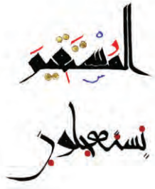
تصویر ۱ - دو گونه اتصال در کوفی شرقی: اتصال افقی مستحکم (بالا) و اتصال «۷» مانند (پایین).

متصل می‌شوند، دو شکل اصلی کاربرد دارد: اتصالات افقی بر پایه خطی به ضخامت دو تا شش دانگ قلم که بر روی خط کرسی قرار می‌گیرد و حروف را به یک‌دیگر متصل می‌کند. دیگر اتصالات مورب که با استفاده از شکلی «۷» مانند که میان حروف متوالی قرار می‌گیرد. البته در اکثر سبک‌های کوفی شرقی ترکیبی از هر دو اتصال دیده می‌شود؛ اما سبک‌ها به میزان تکیه بیشتر بر هریک از این روش‌ها متمایز می‌شوند (تصویر ۱).