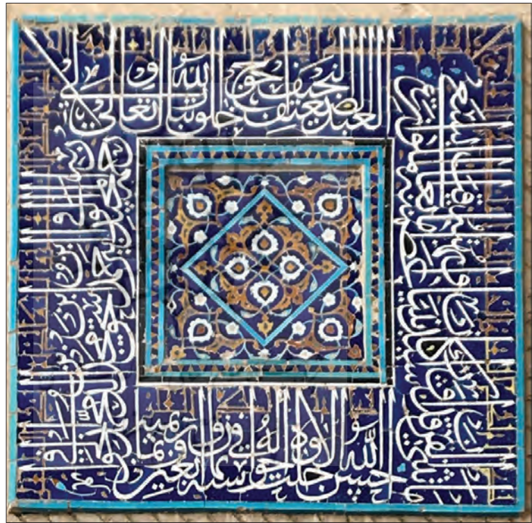
تصویر ۵ - کتیبه مقبره ابوبکر تأییدی در تأیید، سده نهم ق.

کتیبه‌های دوره اسلامی مشاهده می‌گردد که این کتیبه‌ها در یک خط کرسی نوشته می‌شده‌اند و عموماً تغییر کرسی در این نمونه‌ها بسیار نادر بوده است (فرید، ۱۳۹۹). ازسوی دیگر یکی از ویژگی‌های کتیبه‌نویسی خط ثلث سوارنویسی و تغییر در کرسی است. حال با نگاه به کتیبه‌های خط محقق مشاهده می‌گردد که باز بیشتر بخش‌های کتیبه در یک خط کرسی نوشته می‌شود و به دلیل یادی از گذشته از کتیبه‌های فرزند کوفی بهره برده شده است (تصاویر ۴ و ۵).