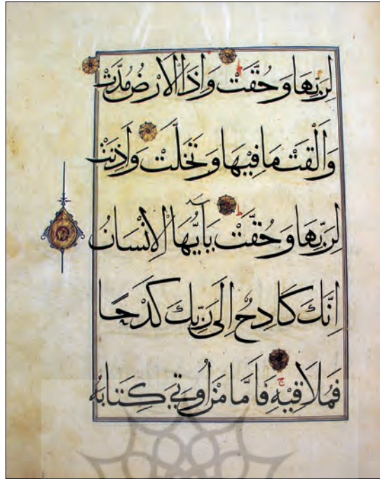
تصویر ۳- برگی از قرآن کارشده در شیراز، اواخر سده هشتم ق.

شاید بتوان مهم‌ترین فرایند این تکامل را در تکامل تراش قلم دانست. «احتمال تغییر در کاربرد نوع جدیدی از قلم‌نی، شکل تازه‌ای در تراشیدن و قط‌زدن نوک آن باشد که موجب حرکت دادن قلم می‌گردد» (بلر، ۱۳۹۶: ۲۰۹).