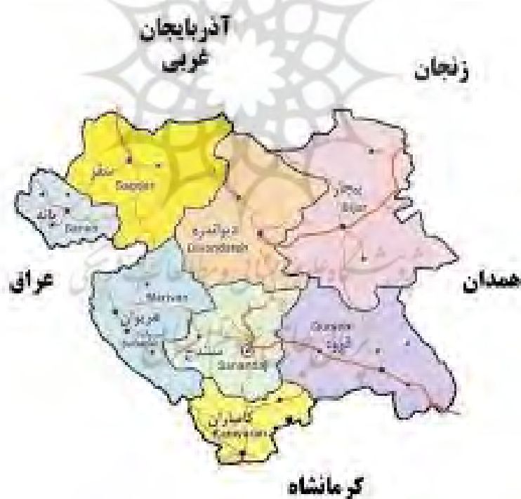
تصویر ۱- موقعیت شهرستان سقز در استان کردستان

سقز یکی از شهرستان‌های استان کردستان است که در شمال غربی مرکز استان یعنی سنندج و در فاصله ۱۸۷ کیلومتری آن واقع شده است و از شمال به آذربایجان غربی و شهر بوکان، از غرب به بانه و از جنوب به مریوان و از شرق به دیواندره محدود می‌گردد. بر اساس آمارهای سرشماری نفوس و مسکن در سال ۱۳۹۰ جمعیت شهرستان ۲۱۰۸۲۰ نفر است (فرمانداری شهرستان سقز).