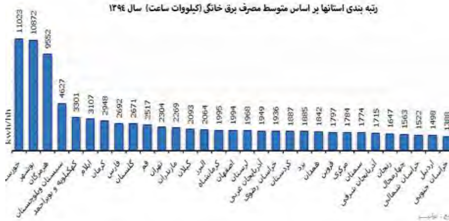
شکل ۱: رتبه‌بندی استان‌ها بر اساس متوسط مصرف برق خانگی (منبع توانیر)

مصرف نامناسب انرژی می‌تواند تبعات منفی مختلفی در حوزه اقتصاد، بهداشت، محیط زیست و غیره را به همراه داشته باشد. به‌عنوان مثال تولید برق از طریق فسیلی و هسته‌ای بیشترین آلودگی را در پی دارد به‌گونه‌ای که نیروگاه‌های برق ممکن است باعث تولید گازها، ذرات معلق، انواع پس‌آب‌ها و یا مواد زاید جامد و خطرناک باشند (مداح و همکاران، ۱۳۹۸). بنابراین تولید فراوان انرژی به آلودگی بیشتر محیط‌زیستی منجر خواهد شد و از سویی دیگر؛ مصرف نامناسب انرژی یکی از موانع عمده توسعه اقتصادی و مهم‌ترین دلیل ایجاد مشکلات محیط‌زیستی قلمداد می‌شود. مصرف انرژی در جوامع و کشورهای مختلف متفاوت است و می‌توان گفت فرهنگ مصرف انرژی با توجه به شرایط و مقتضیات مختلف می‌تواند متفاوت باشد و تحلیل‌های مختلفی در این رابطه عرضه می‌شود. به دلیل شرایط نامناسب مصرف گاز و برق در جامعه ایران و مسائل ناشی از این پدیده و همچنین مصرف روبه رشد این دو منبع حیاتی در بخش خانگی شهر مشهد به عنوان دومین کلان‌شهر ایران، در این پژوهش تلاش شد تا فرهنگ مصرف انرژی در این شهر مورد مطالعه قرار گیرد. بر این اساس این تحقیق به دنبال شناسایی فرهنگ مصرف انرژی در بین خانوارهای مشهدی و میزان گستردگی این فرهنگ هاست.