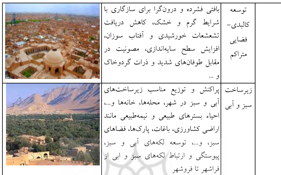
جدول ۴- تحلیل اصول حاکم بر ساختار، عملکرد و مدیریت سازه‌های آبی تاریخی در مقیاس میانی