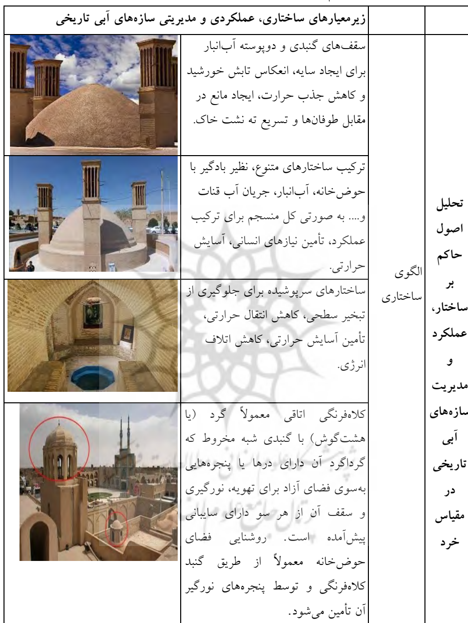
جدول ۵- تحلیل اصول حاکم بر ساختار، عملکرد و مدیریت سازه‌های آبی تاریخی در مقیاس خرد