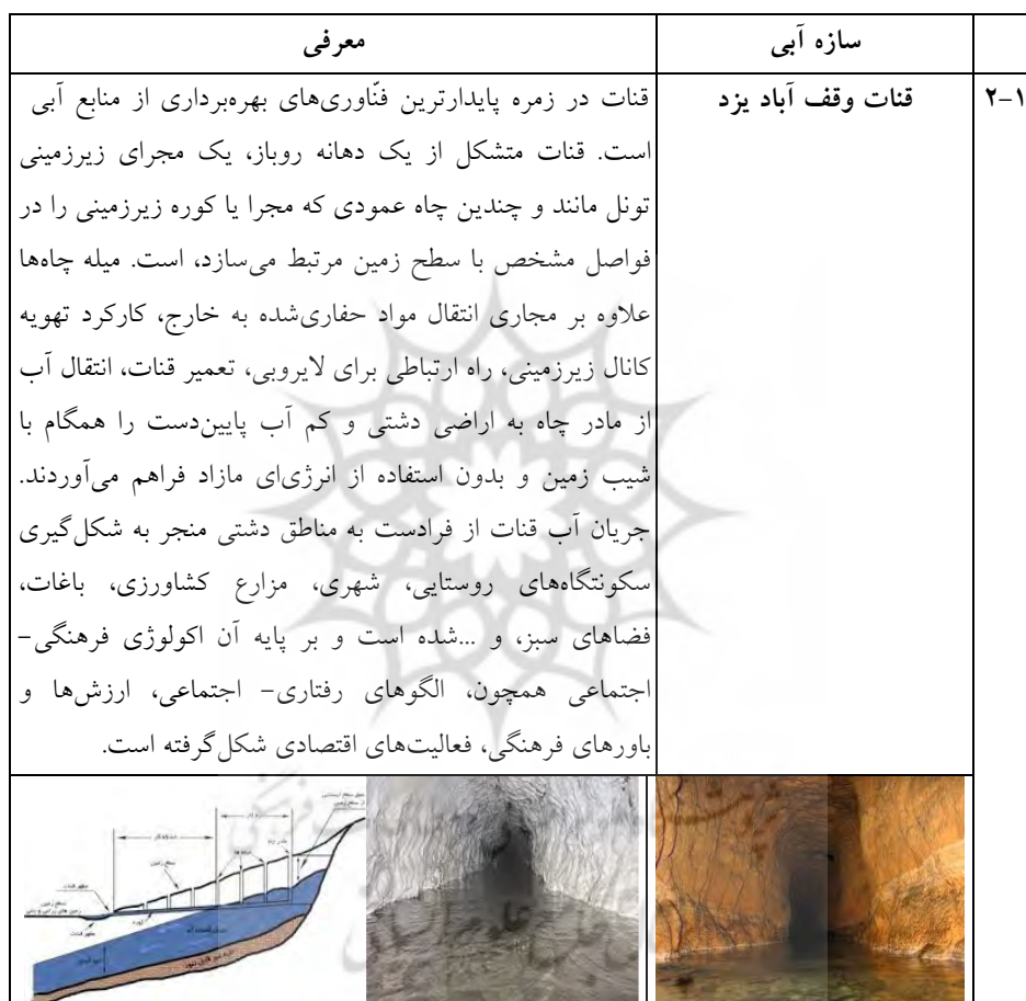
جدول ۱-۲- معرفی سازه آبی تاریخی، قنات وقف آباد

جداول شماره ۲ به معرفی قنات وقف آباد یزد به عنوان یکی از مهم ترین قنات های این شهر کویری و سازه های آبی مرتبط با آن پرداخته می شود.