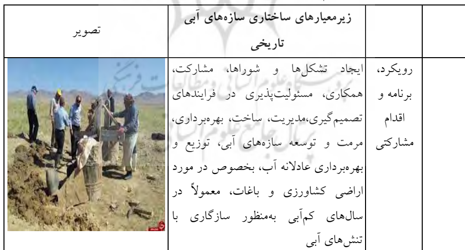
جدول ۳- تحلیل اصول حاکم بر ساختار، عملکرد و مدیریت سازه‌های آبی کهن در مقیاس کلان

ویژگی‌های حاکم بر سازه‌های آبی تاریخی در یک چارچوب فکری منسجم به‌گونه‌ای شکل گرفته‌اند که ضمن تأمین شریان حیاتی شهر و خلق سکونتگاه‌های انسانی، با حداقل تأثیرات منفی بر محیط طبیعی، بهترین کیفیت زندگی را با توجه به بستر محیطی و شرایط اکولوژیک برقرار نماید و تعادلی پویا و مانا بین محیط طبیعی و مصنوع شکل گیرد. با توجه به توضیحات مذکور تحلیل اصول عقلانیت اکولوژیک در ساختار، عملکرد و مدیریت سازه‌های آبی تاریخی، همراه با تصاویری از مصادیق در مقیاس کلان (جدول ۳)، مقیاس میانی (جدول ۴)، مقیاس خرد (جدول ۵) به تصویر کشیده شده است.