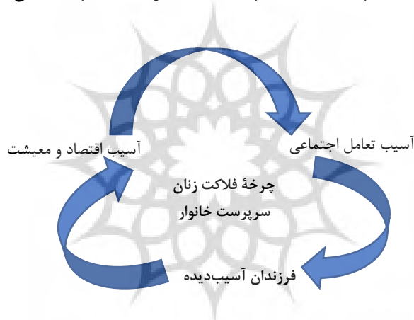
شکل ۱. چرخه فلاکت زنان سرپرست خانوار

عدم حضور پدر موجب بروز مشکلات و آسیب‌های اجتماعی در فرزندان این خانوارها می‌شود. دوگانگی نقش علاوه بر احساس فشار روی زن سرپرست خانوار می‌تواند مشکلاتی را برای فرزندان آنان نیز به همراه بیاورد. فرزندان این خانوارها به‌طور بالقوه در معرض مسائلی مانند محرومیت از تحصیل، بزهکاری اجتماعی و سوءتغذیه و کار کودکان در مشاغل سیاه و غیررسمی قرار دارند. همچنین ممکن است زنان سرپرست خانوار و فرزندان آنها در معرض سوءاستفاده‌های مختلف از جمله سوءاستفاده جنسی قرار بگیرند. شاید بتوان گفت آسیب‌پذیری اخلاقی و انزواجویی از نگران‌کننده‌ترین ویژگی‌های زنان سرپرست خانوار است. فقدان بسیاری از فرصت‌ها (فرصت داشتن خانواده خوب، داشتن پدر، تحصیل مناسب و...) برای این نوع خانواده‌ها به‌نوعی موجب استمرار و بازتولید چرخه فلاکت (آسیب اقتصادی، آسیب تعاملات و فرزندان آسیب‌دیده) می‌شود.