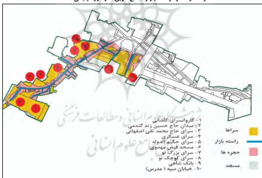
نقشه شماره ۴: رشد و توسعه بازار (ضلع غربی) در دوره پایانی (۱۳۰۴-۱۲۶۰)