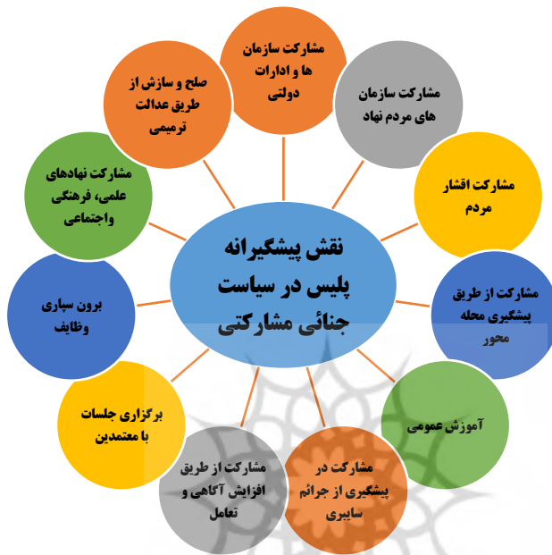
شکل 1- مدل نهایی